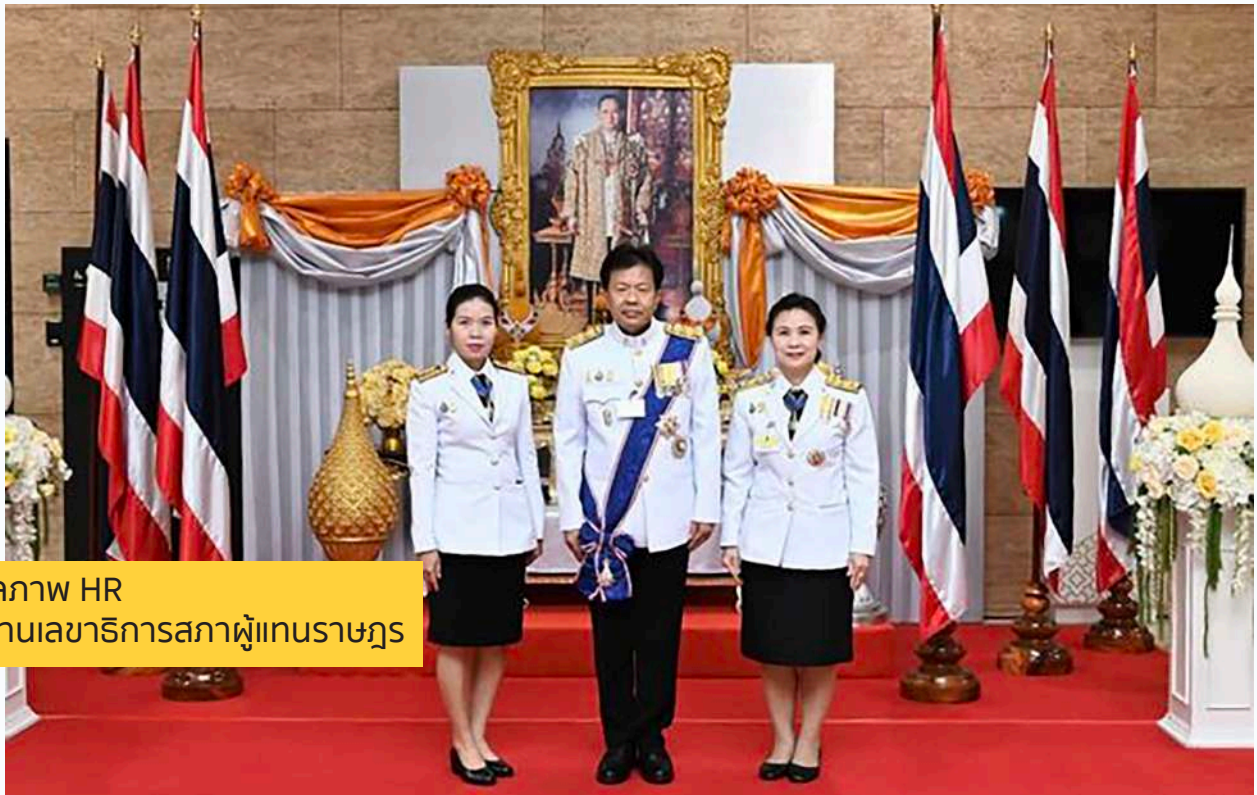
ประมุขภาพ HR สำนักงานเลขาธิการสภาผู้แทนราษฎร