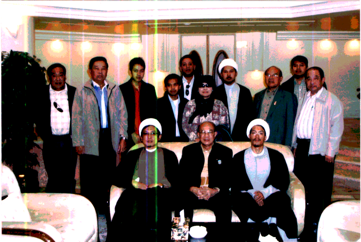
พลเอก จรัล กุลละวณิชย์ (นั่งกลาง) ถ่ายภาพเป็นที่ระลึกร่วมกับคณะนักศึกษาไทยที่เมืองกุมในอิหร่าน ในวันที่ ๑๖ พฤศจิกายน ๒๕๕๐ โดยคณะผู้แทนได้สนทนถึงการใช้ชีวิตและความเป็นอยู่ของนักศึกษา พร้อมเชิญให้ร่วมรับประทานอาหารกลางวัน ณ โรงแรมที่เมืองกุมด้วย