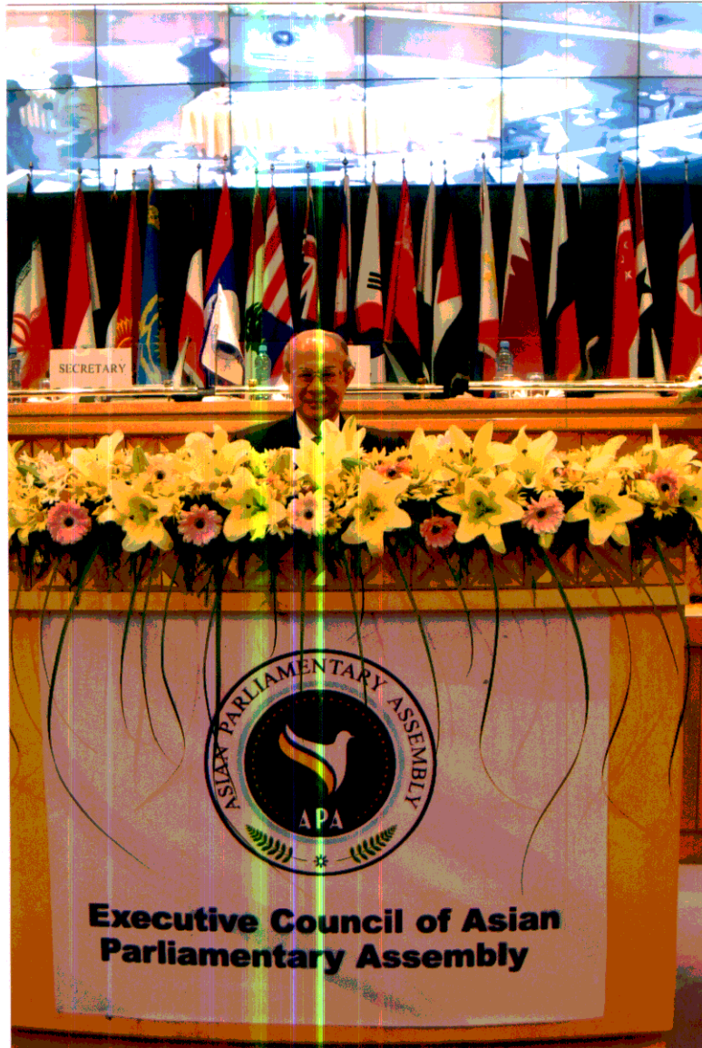
พลเอก จรัล กุลละวณิชย์ รองประธานสภานิติบัญญัติแห่งชาติ คนที่หนึ่ง ทำหน้าที่หัวหน้าคณะผู้แทนไทย กล่าวสุนทรพจน์ต่อที่ประชุมคณะกรรมการบริหารของ APA หลังพิธีเปิดการประชุมในวันที่ ๑๗ พฤศจิกายน ๒๕๕๐ ณ ศูนย์ประชุมรุงเทพมหานคร สาธารณรัฐอิสลามอิหร่าน