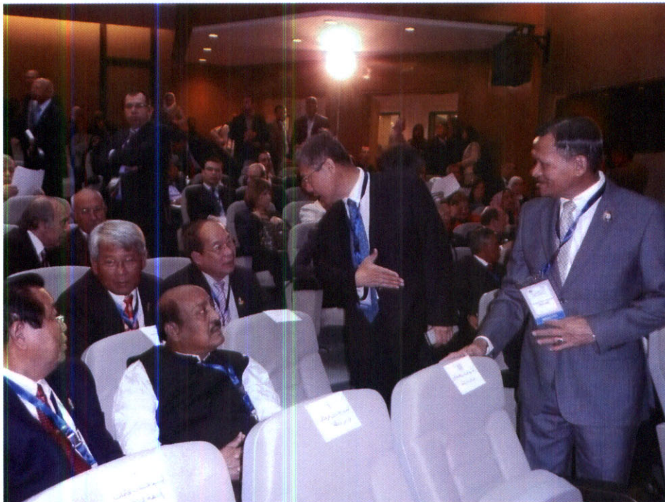
นายไพโรจน์ ตันบรรจง หัวหน้าคณะผู้แทนรัฐสภาไทยและพันตำรวจเอก สนธยา แสงเภา ผู้แทนรัฐสภาไทย ทักทายกับผู้แทนรัฐสภา ราชอาณาจักรกัมพูชา