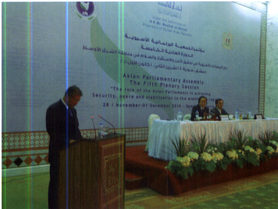
นายไพโรจน์ ตันบรรจง หัวหน้าคณะผู้แทนรัฐสภาไทย ขึ้นกล่าวถ้อยแถลงระหว่างการประชุมเต็มคณะ ครั้งที่ ๒