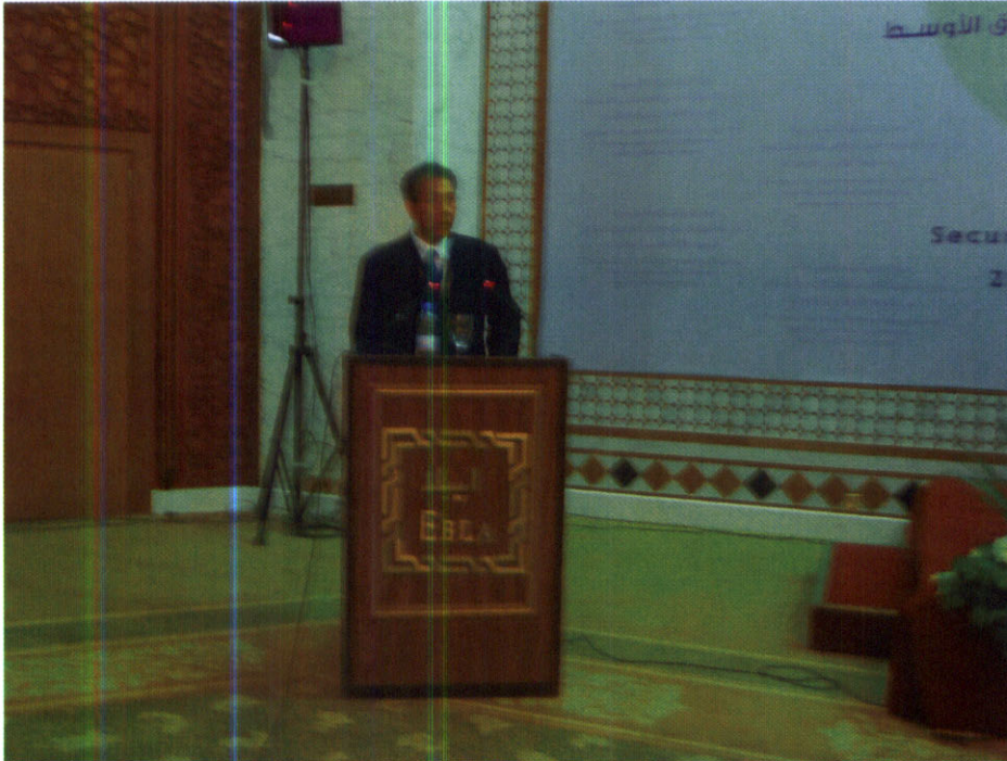
นายไพโรจน์ ตันบรรจง หัวหน้าคณะผู้แทนรัฐสภาไทย ขณะกล่าวถ้อยแถลงระหว่างการประชุมเต็มคณะ ครั้งที่ ๒