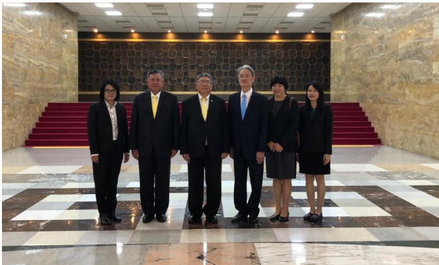
คณะผู้แทนสภานิติบัญญัติแห่งชาติเข้าร่วมการประชุมเพื่อเตรียมการประชุม คณะกรรมการบริหารสหภาพลูกเสือรัฐสภาโลก ณ อาคารรัฐสภาเกาหลี