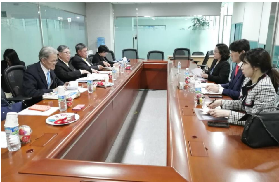
คณะผู้แทนสถานิติบัญญัติแห่งชาติ นำโดยนายธำรง ทศนาญชลี ทหารีอกับ นาย Yong Tak Cho เลขาธิการ WSPU และเจ้าหน้าที่ WSPU