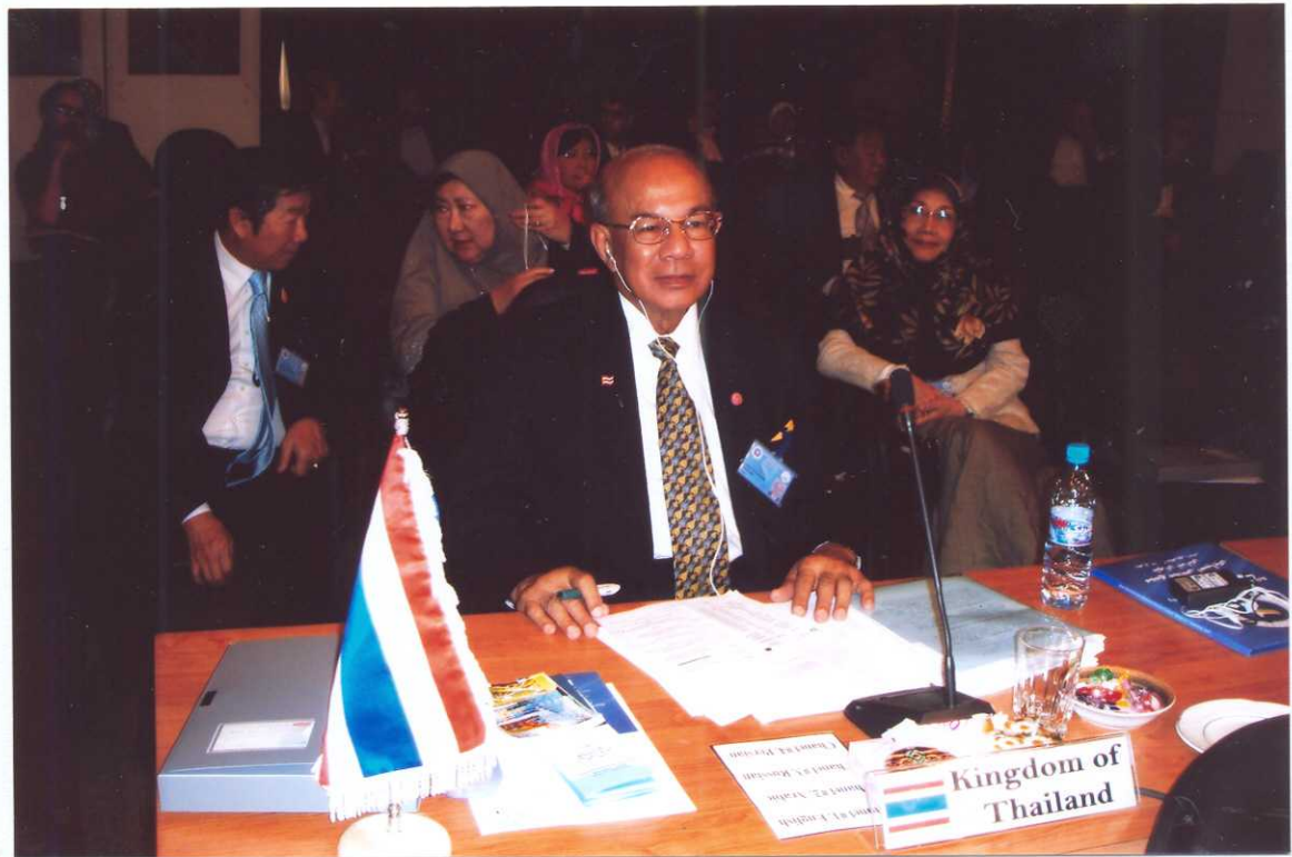
พลเอก จรัล กุลละวณิชช์ รองประธานสถานีวิทยุโทรทัศน์แห่งชาติ คนที่หนึ่ง ทำหน้าที่หัวหน้าคณะผู้แทนไทยในการประชุมคณะกรรมการบริหารของสมัชชารัฐสภาเอเชีย ในวันที่อาทิตย์ที่ ๕ กันยายน ๒๕๕๐ ณ ศูนย์การประชุม กรุงเทพมหานคร สาธารณรัฐอิสลามอิหร่าน