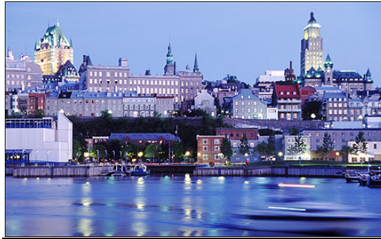
เมืองควิเบก ประเทศแคนาดา (ภาพจาก etadventures.com/destinations/quebec-city-tours )