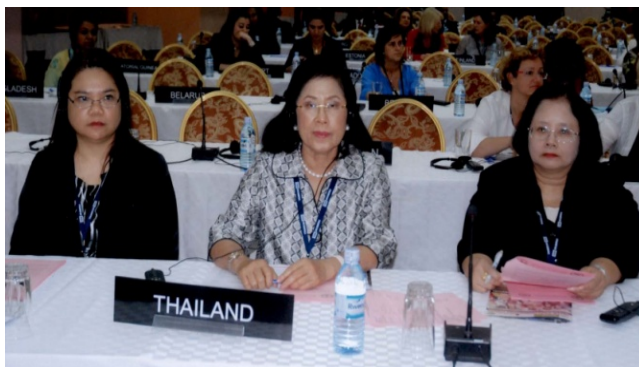
รองศาสตราจารย์ทัศนาศ บุญทอง สมาชิกวุฒิสภา รองหัวหน้าคณะผู้แทนรัฐสภาไทย เข้าร่วมการประชุมสมาชิกรัฐสภาสตรี

รองศาสตราจารย์ทัศนาศ บุญทอง สมาชิกวุฒิสภา รองหัวหน้าคณะผู้แทนรัฐสภาไทยได้รับเลือกตั้งให้เป็นผู้เสนอรายงานการประชุมสมาชิกรัฐสภาสตรีในการประชุมกลุ่มย่อยเกี่ยวกับบทบาทสมาชิกรัฐสภาสตรีในหัวข้อการประชุมที่เกี่ยวกับการกระจายอำนาจไม่เฉพาะความมั่งคั่ง : การร่วมเป็นเจ้าของวาระนานาชาติ และได้กล่าวถ้อยแถลงในการประชุมคณะกรรมการสิทธิการสหภาพรัฐสภาว่าด้วยประชาธิปไตยและสิทธิมนุษยชนเกี่ยวกับหัวข้อการเข้าถึงบริการด้านสุขภาพ : บทบาทรัฐสภาในการแก้ไขสิ่งท้าทายหลักเพื่อประกันสุขภาพของสตรีและเด็ก โดยระบุถึงการพัฒนาบริการสุขภาพในประเทศไทยซึ่งมุ่งเน้นที่การส่งเสริมการเข้าถึงบริการสุขภาพอย่างทั่วถึงในฐานะสิทธิขั้นพื้นฐานและการปรับปรุงระบบสาธารณสุขแห่งชาติเพื่อบรรลุเป้าหมายการพัฒนาแห่งสหัสวรรษของสหประชาชาติ