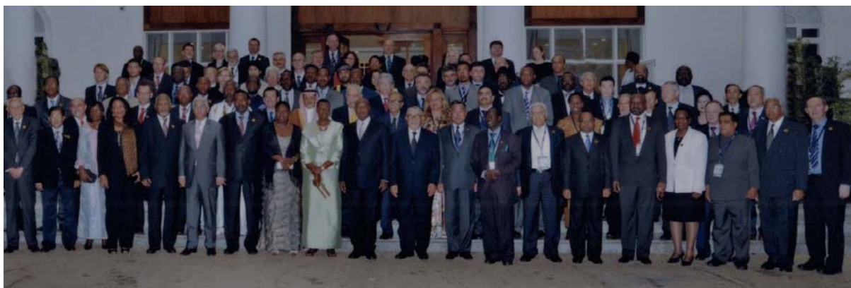
พลเอก ชีรเดช มีเพียร ประธานวุฒิสภา ถ่ายภาพร่วมกับ H.E. Mr. Museveni ประธานาธิบดี สาธารณรัฐยูกันดาและหัวหน้าคณะผู้แทนประเทศต่าง ๆ ทำเนียบประธานาธิบดีสาธารณรัฐยูกันดา

คณะผู้แทนรัฐสภาไทยนำโดย พลเอก ชีรเดช มีเพียร ประธานวุฒิสภาและรองประธานหน่วย- ประจำชาติไทยในสหภาพรัฐสภาเดินทางเข้าร่วมการประชุมสมัชชาสหภาพรัฐสภา ครั้งที่ ๑๒๖ ระหว่างวันที่ ๓๑ มีนาคม - ๕ เมษายน ๒๕๕๕ ณ กรุงกัมปาลา สาธารณรัฐยูกันดา