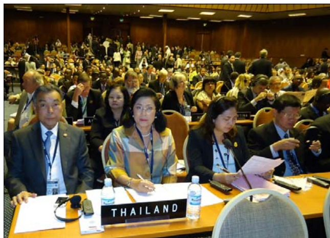
พลเอก อิศเรช มีเพียร ประธานวุฒิสภา นำคณะผู้แทนรัฐสภาไทยเข้าร่วมการประชุมสมัชชาสหภาพรัฐสภา ครั้งที่ ๑๒๖

๔. การริเริ่มของสหภาพรัฐสภา เพื่อยุติการนองเลือดและการละเมิดสิทธิมนุษยชนในซีเรียและความจำเป็นเพื่อประกันการเข้าถึงความช่วยเหลือด้านมนุษยชนธรรมสำหรับทุกคนและสนับสนุนการปฏิบัติตามข้อมติที่เกี่ยวข้องที่ได้รับการรับรองและความพยายามเพื่อสันติภาพของสันนิบาตอาหรับและสหประชาชาติทุกครั้ง (Inter-Parliamentary Union initiative for an immediate halt to the bloodshed and human rights violations in Syria, and the need to ensure access to humanitarian aid for all persons in need and to support implementation of all relevant Arab League and United Nations resolutions and peace efforts) มีมติสนับสนุนให้มีการคว่ำบาตรทางเศรษฐกิจและการทูตต่อรัฐบาลซีเรียจนกว่าสถานการณ์นองเลือดในประเทศจะดีขึ้น