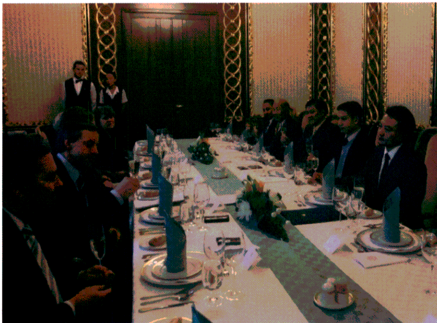
งานเลี้ยงรับรองอาหารกลางวันโดยประธานกลุ่มมิตรภาพฯ เช็ก-อาเซียน (คนที่ ๒ จากซ้ายมือ)