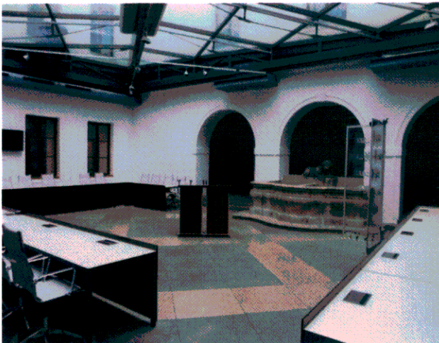
พื้นที่แถลงข่าวของผู้สื่อข่าว