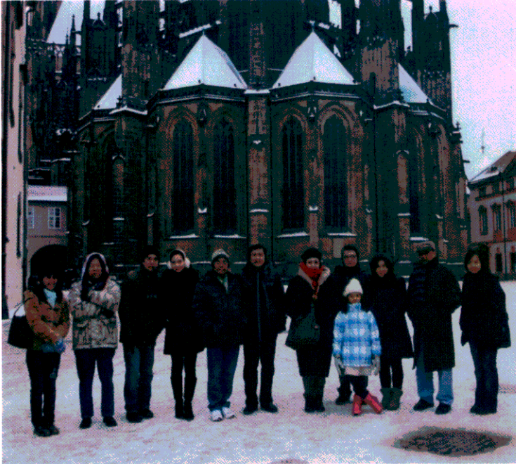
คณะผู้แทนฯ ถ่ายภาพร่วมกันหน้ามหาวิหารเซนต์วิตัส เมื่อวันที่ ๒๐ มกราคม ๒๕๕๖