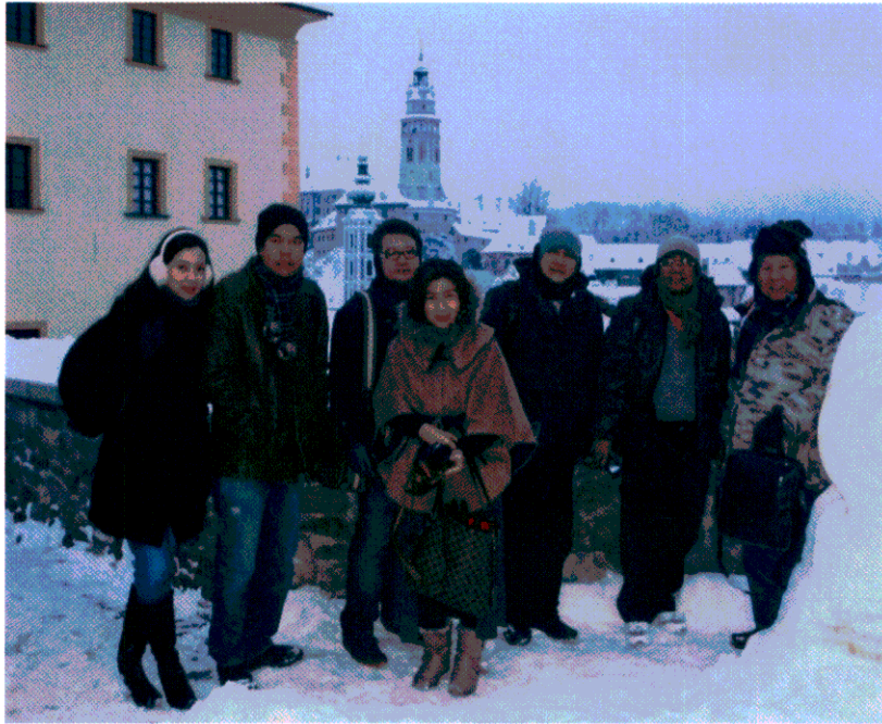
คณะผู้แทนฯ เดินทางเยี่ยมชมเมืองเชสกี ครุมลอฟ เมื่อวันที่ ๑๙ มกราคม ๒๕๕๖