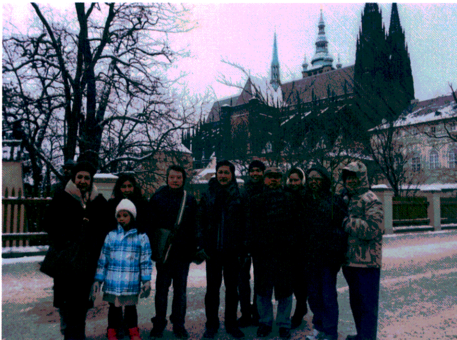
คณะผู้แทนฯ ถ่ายภาพร่วมกันบริเวณหน้าปราสาทปราก เมื่อวันที่ ๒๐ มกราคม ๒๕๕๖