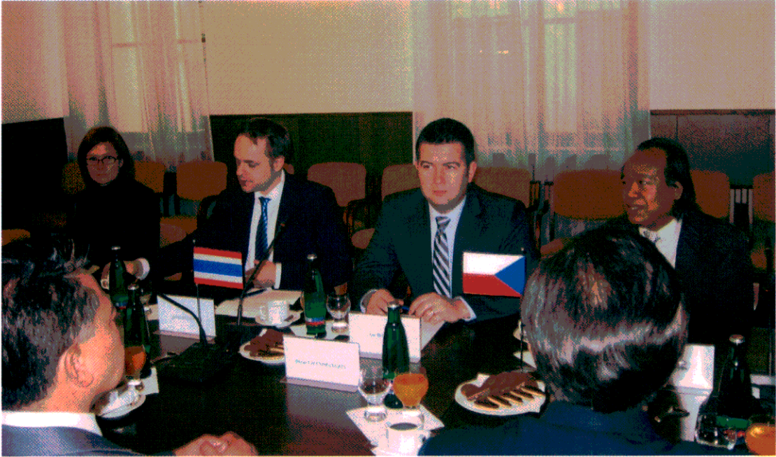
รองประธานสภาผู้แทนราษฎรสาธารณรัฐเช็ก (คนที่ ๒ จากขวามือ)