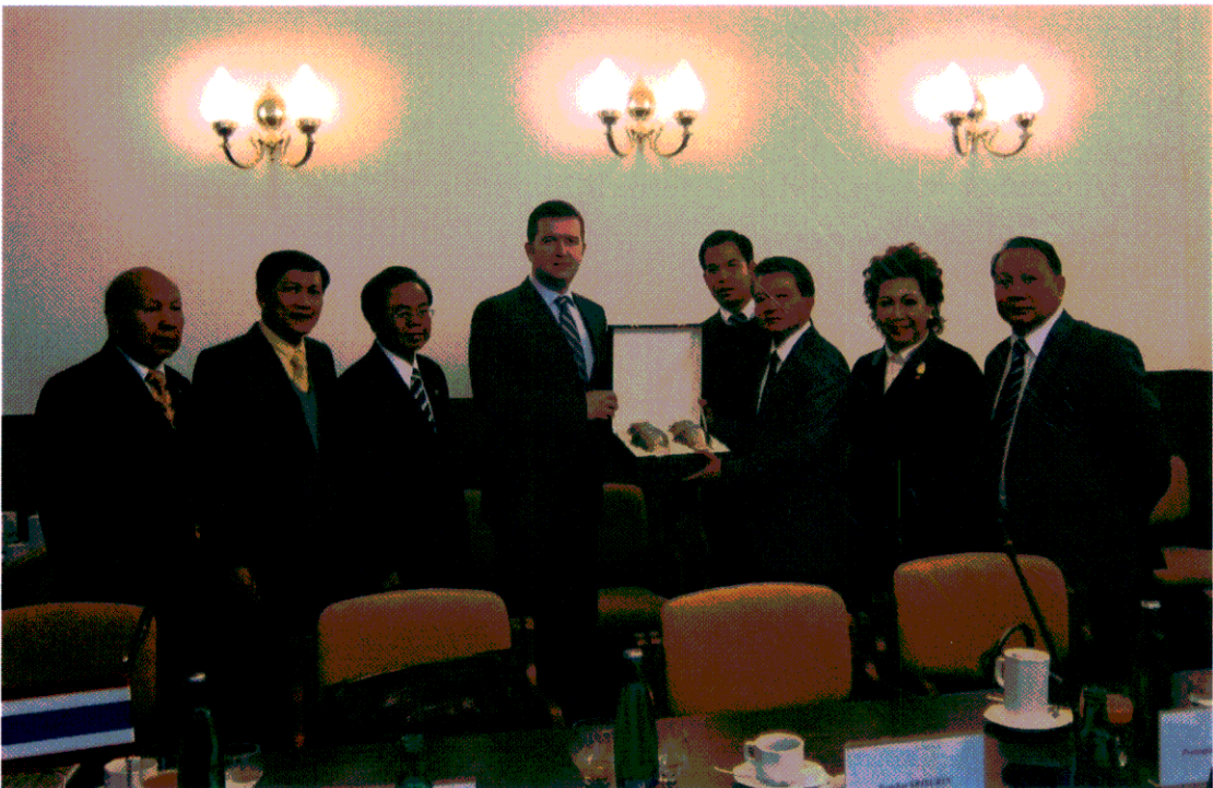
การมอบของที่ระลึกแก่รองประธานสภาผู้แทนราษฎร