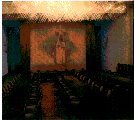
พื้นที่พักผ่อนของสมาชิกสภาผู้แทนราษฎร