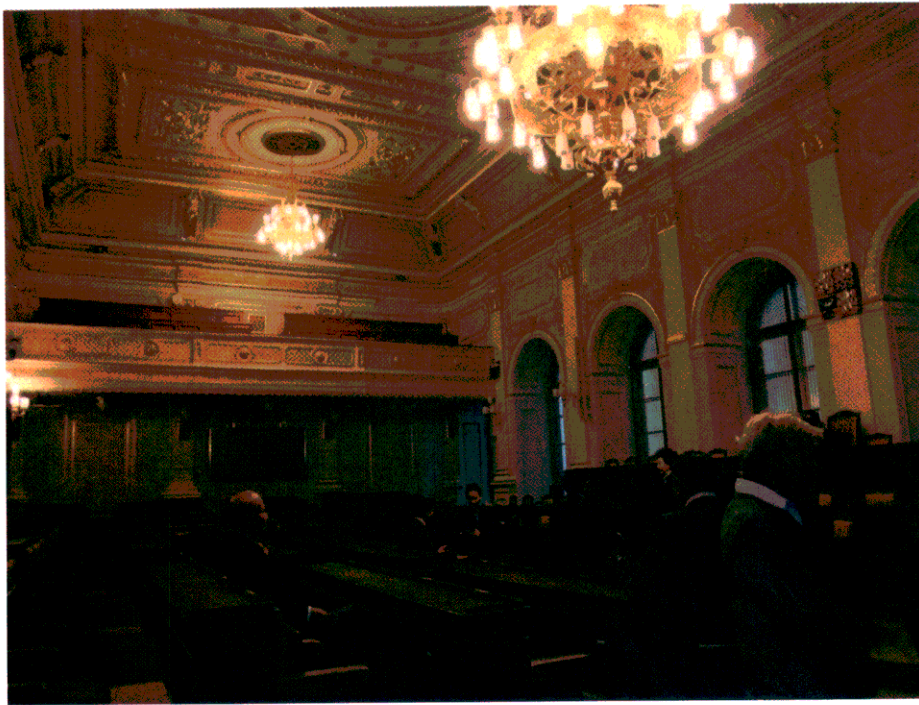
ห้องประชุมสภาผู้แทนราษฎร