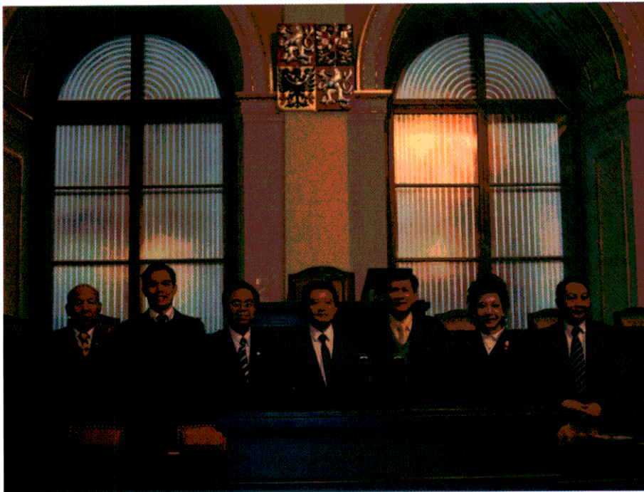
ห้องประชุมสภาผู้แทนราษฎร โดยด้านหลังเป็นบัลลังก์ของประธานสภาผู้แทนราษฎร