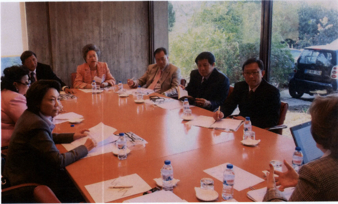
คณะเดินทางเยี่ยมชมพิพิธภัณฑ์ Calouste Gulbenkian