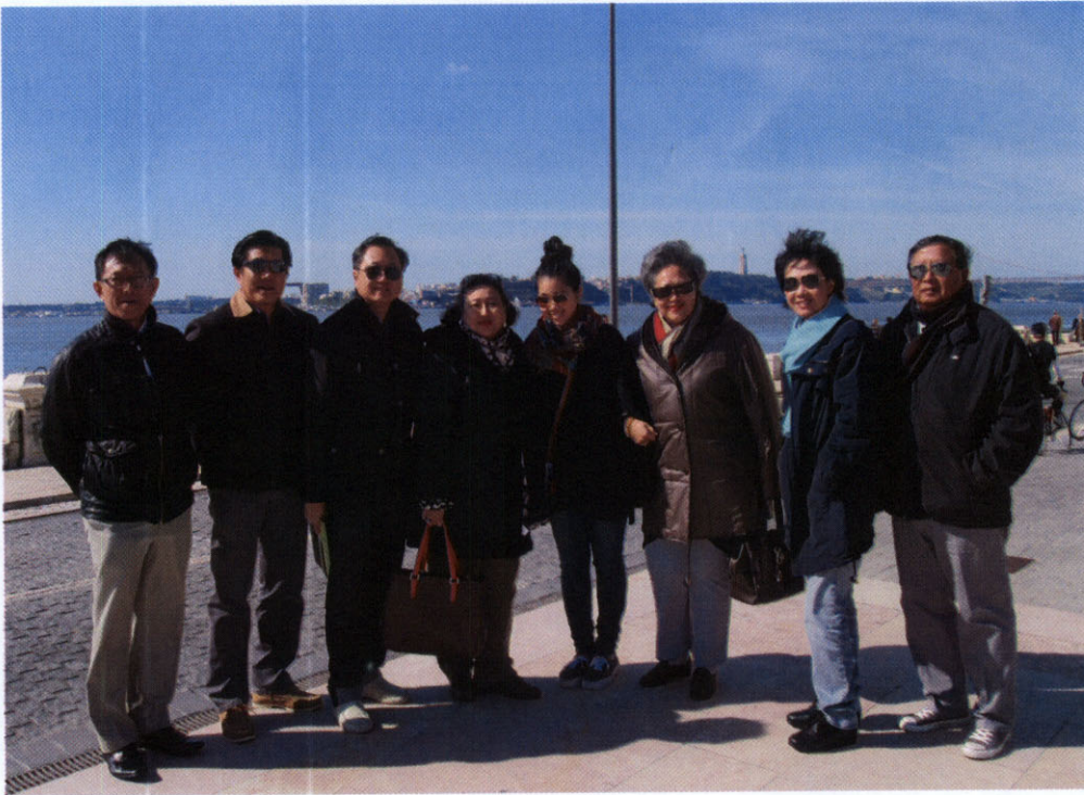
คณะถ่ายภาพร่วมกันบริเวณจัตุรัส Commerce โดยด้านหลังเป็นสะพาน 25th of April