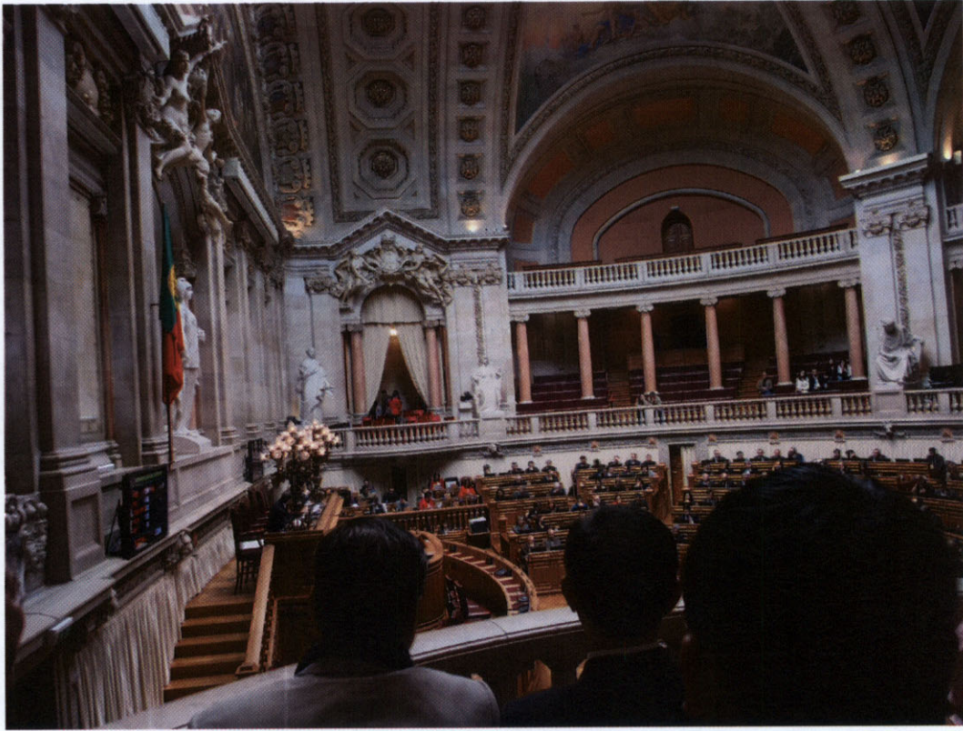
คณะผู้แทนกลุ่มมิตรภาพฯ ไทย-โปรตุเกส เข้าร่วมฟังการประชุมรัฐสภา