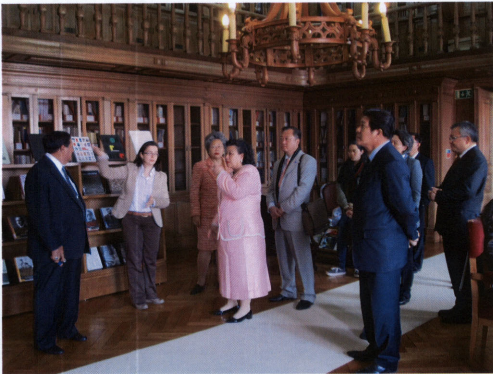
คณะผู้แทนกลุ่มมิตรภาพฯ ไทย-โปรตุเกส เยี่ยมชมห้องสมุดรัฐสภา