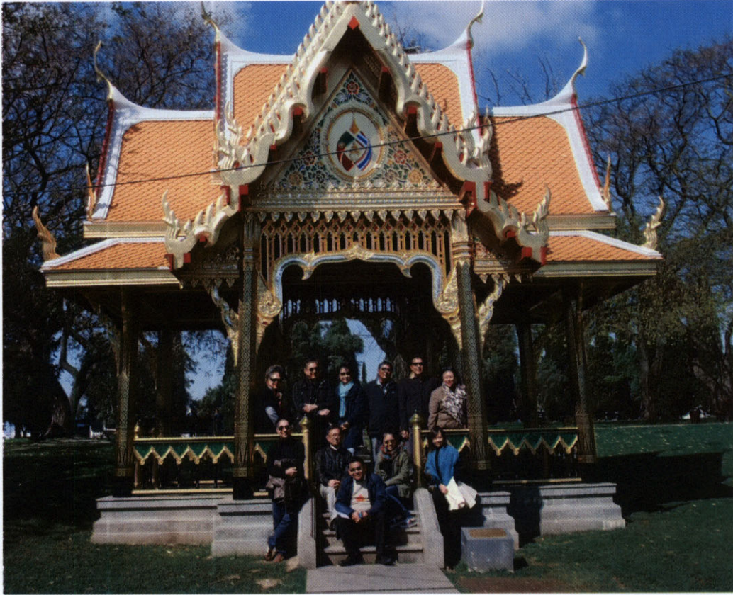
คณะถ่ายภาพร่วมกัน ณ ศาลาไทย