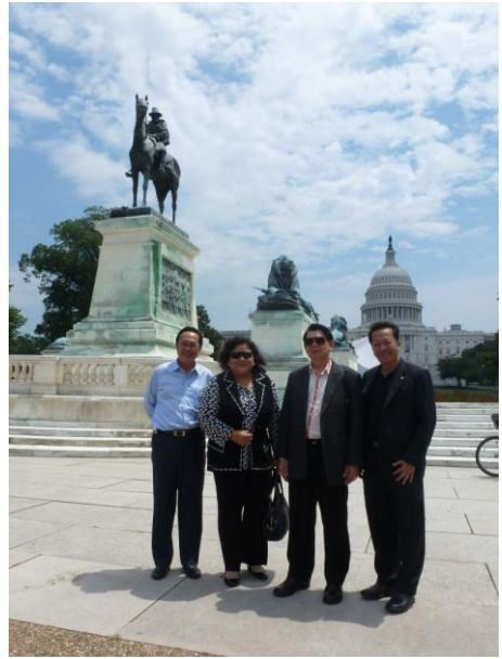
อาคารรัฐสภาสหรัฐอเมริกา