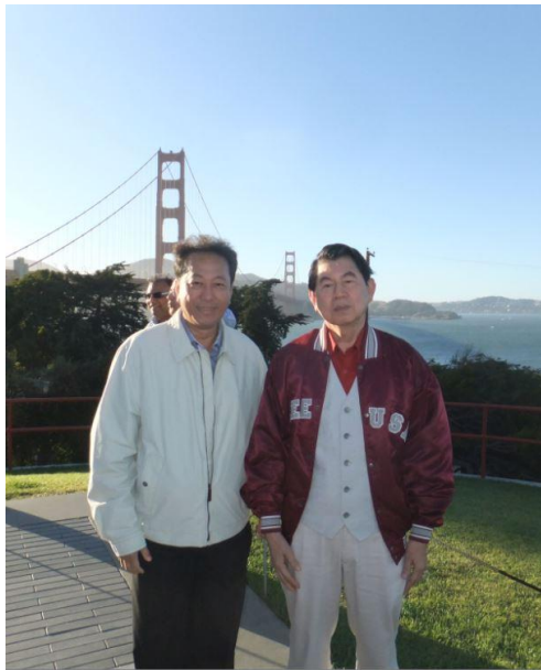
สะพานโกลด์เดนเกต