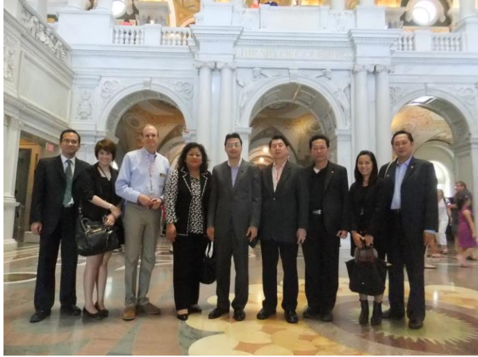
หอสมุดรัฐสภา