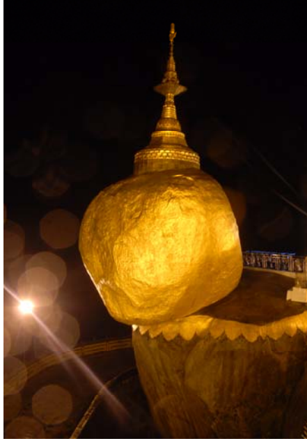
พระธาตุนิทร์แขวน เมืองใจด์ทีโย