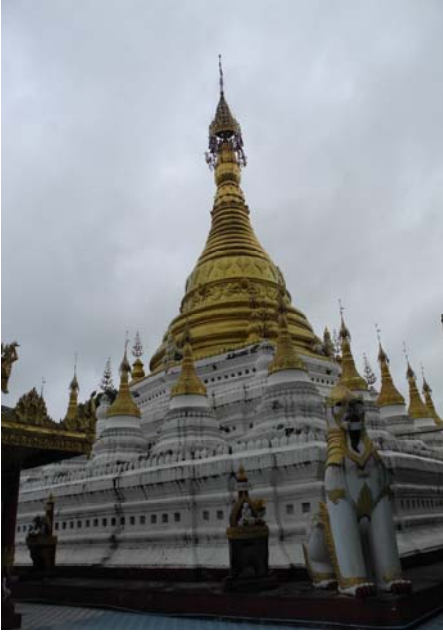
เจดีย์เก้ามุดอว่ เมืองตองอู