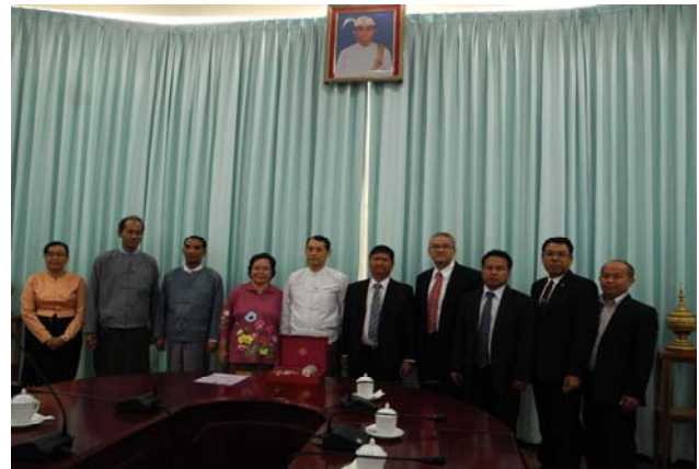
คณะฯ พบปะหารือกับนายอ่อง ลิน อธิบดีกรมอาเซียน ณ กระทรวงการต่างประเทศ กรุงเนปิดอร์