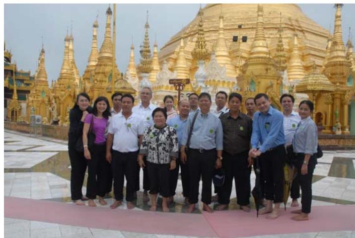
คณะฯ สักการะพระมหาเจดีย์ชเวดากอง เมืองย่างกุ้ง

คณะฯ ได้เยี่ยมชมสถานที่สำคัญทางประวัติศาสตร์และศาสนสถานที่สำคัญของเมียนมาร์ ในเมืองต่างๆ อาทิ พระมหาเจดีย์ชเวดากองแห่งเมืองย่างกุ้ง พระมหาเจดีย์ชเวดากองจำลองแห่งกรุงเนปิดอร์ เจดีย์ชเวซันดอร์ เจดีย์เก้ามูดอแห่งเมืองตองอู พระธาตุนิรทรวานแห่งเมืองใจ้ต็ทโย พระธาตุมุเตาแห่งเมืองหงสาวดี เป็นต้น