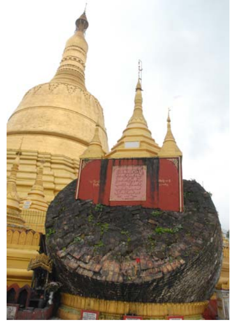
พระธาตุมุเตา เมืองหงสาวดี