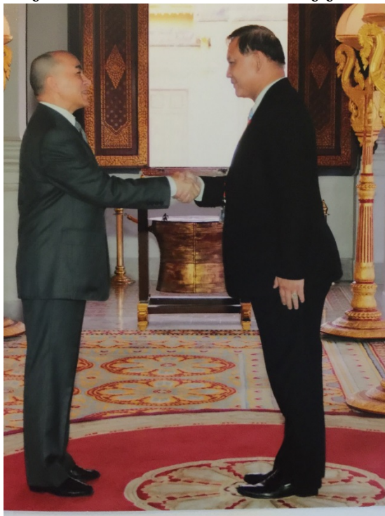
พลเรือเอก อมรเทพ ณ บางช้าง สมาชิกสภานิติบัญญัติแห่งชาติ และหัวหน้าคณะผู้แทนฯ เข้าเฝ้าฯ พระบาทสมเด็จพระบรมนาถนโรดมสีหมุนี กษัตริย์แห่งราชอาณาจักรกัมพูชา

อนึ่ง ในระหว่างการประชุมดังกล่าว พลเรือเอก อมรเทพ ณ บางช้าง หัวหน้าคณะผู้แทนสภานิติบัญญัติแห่งชาติ ยังได้เข้าเฝ้าฯ พระบาทสมเด็จพระบรมนาถนโรดมสีหมุนี กษัตริย์แห่งราชอาณาจักรกัมพูชา และเข้าเยี่ยมคารวะสมเด็จพระอัครมหาพญาจักรี เฮง สัมริน ประธานสภาแห่งชาติกัมพูชาและประธาน APA คนปัจจุบัน โดยหัวหน้าคณะผู้แทนฯ ได้ทูลเกล้าทูลกระหม่อมถวายของที่ระลึกแก่พระบาทสมเด็จพระบรมนาถนโรดมสีหมุนี และได้มอบของที่ระลึกให้แก่สมเด็จพระอัครมหาพญาจักรีเฮง สัมริน ในนามของสภานิติบัญญัติแห่งชาติ อีกด้วย