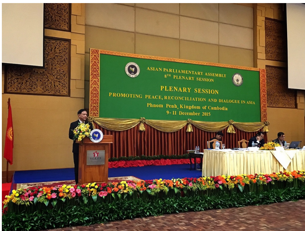
พลเรือเอก อมรเทพ ฦ บางช้าง สมาชิกสภานิติบัญญัติแห่งชาติ และหัวหน้าคณะผู้แทนฯ กล่าวถ้อยแถลงในที่ประชุมสมัชชาใหญ่สมัชชารัฐสภาเอเชีย (APA) ครั้งที่ ๘

ในการประชุมสมัชชาใหญ่ในครั้งนี้ คณะผู้แทนฯ ได้แสดงบทบาทของสภานิติบัญญัติแห่งชาติในที่ประชุม APA โดย พลเรือเอก อมรเทพ ฦ บางช้าง หัวหน้าคณะผู้แทนฯ ได้กล่าวถ้อยแถลงของไทยในระหว่างการประชุมสมัชชาใหญ่ (Plenary Session) โดยมีเนื้อหาสำคัญที่เน้นย้ำกระบวนการเจรจาพูดคุยเพื่อให้เกิดความปรองดองและสันติภาพในภูมิภาค พันธสัญญาที่ประเทศไทยมีต่อมิตรประเทศที่เป็นประเทศสมาชิกของ APA ในการให้ความร่วมมือระหว่างกัน เพื่อส่งเสริมกระบวนการต่างๆ อันจะทำให้องค์กรอย่าง APA บรรลุเป้าประสงค์ตามเจตนารมณ์ ที่ต้องการ