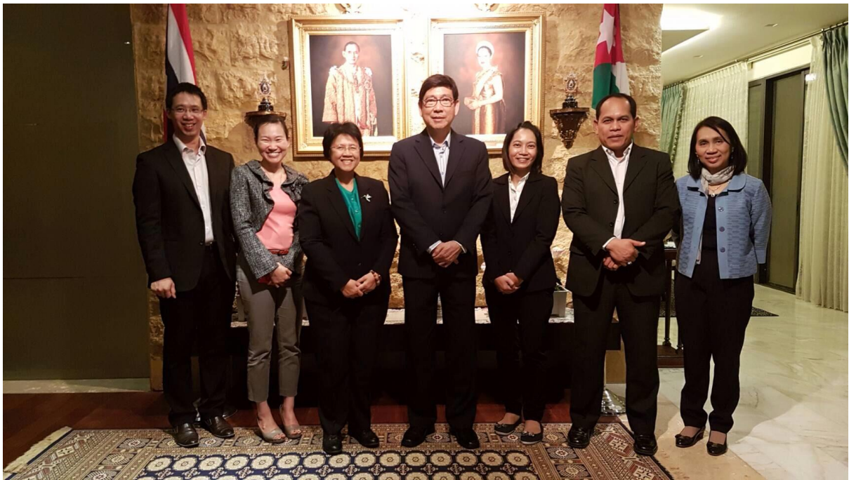
นายอภิชาติ เพ็ชรรัตน์ เอกอัครราชทูต ณ กรุงอัมมาน เลี้ยงอาหารค่ำเพื่อเป็นเกียรติแก่คณะผู้แทน- สถานิติบัญญัติแห่งชาติ ณ ทำเนียบเอกอัครราชทูต ณ กรุงอัมมาน