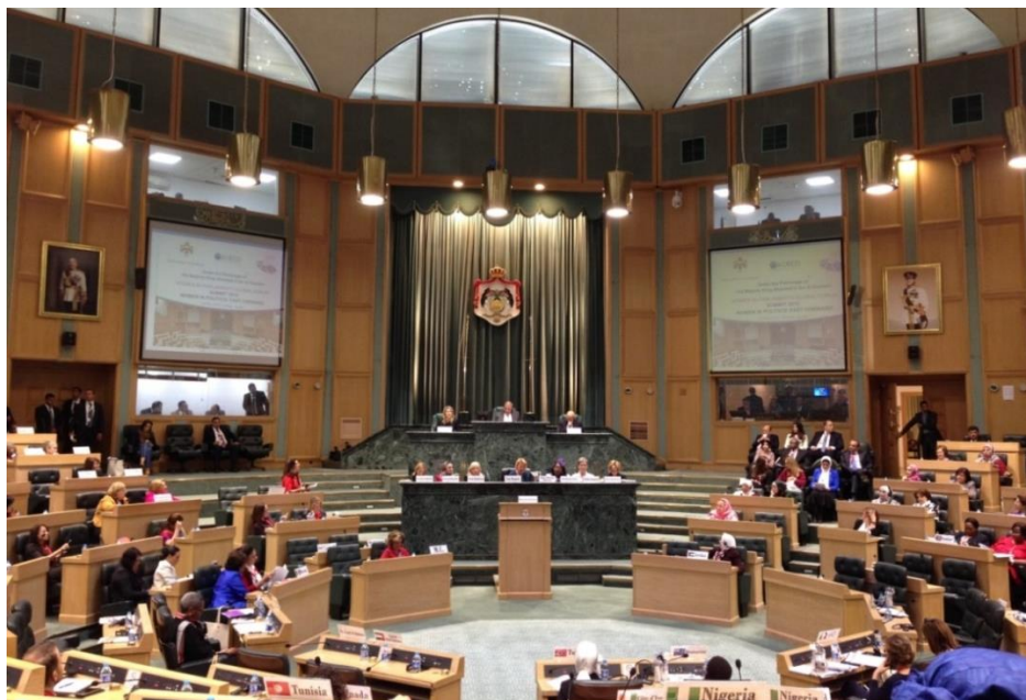
บรรยากาศในช่วงการประชุมเต็มคณะ