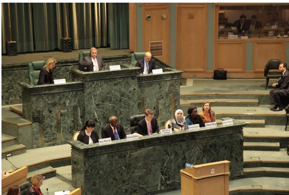
บรรยากาศการประชุมเต็มคณะ