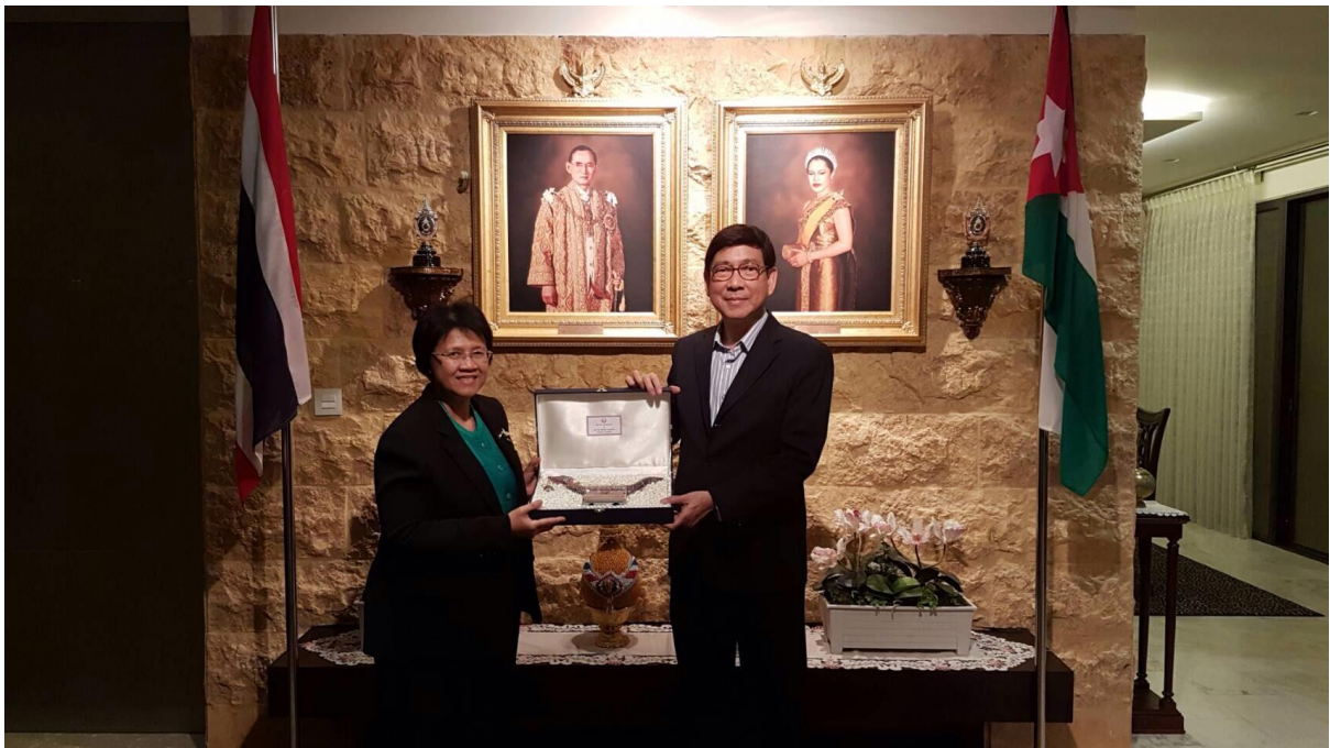
นางกาญจนารัตน์ สิวโรจน์ หัวหน้าคณะผู้แทนสถานิติบัญญัติแห่งชาติ มอบของที่ระลึกแก่นายอภิชาติ เพ็ชรรัตน์ เอกอัครราชทูต ณ กรุงอัมมาน