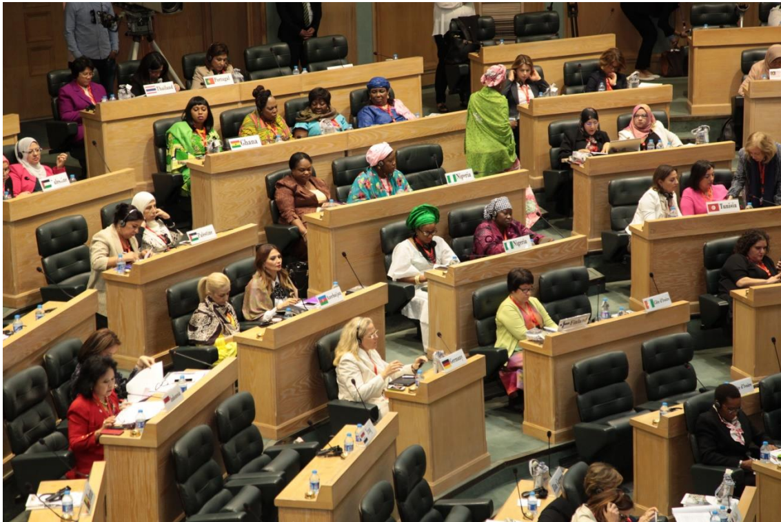
บรรยากาศในช่วงพิธีปิดการประชุม