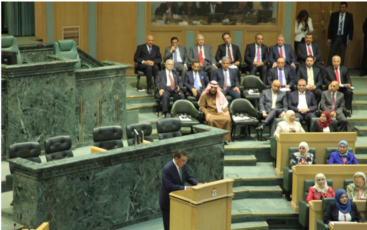
H.E. Mr. Atef Tarawneh ประธานสภาผู้แทนราษฎรราชอาณาจักรฮัชไมต์จอร์แดน กล่าวต้อนรับในพิธีเปิดการประชุม