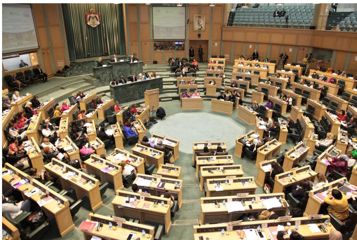
บรรยากาศการประชุมระดับโลกสตรีในรัฐสภา ๒๕๕๙

การประชุมระดับโลกสตรีในรัฐสภา ๒๕๕๙ ครั้งนี้นับเป็นการประชุมสตรีในระดับนานาชาติครั้งแรกของประเทศในภูมิภาคตะวันออกกลางและแอฟริกาเหนือ (Middle East and North Africa : MENA) ซึ่งจัดขึ้นโดยความร่วมมือระหว่างองค์กรสตรีในรัฐสภา (WIP) ร่วมกับรัฐสภาจอร์แดน และองค์การเพื่อความร่วมมือทางเศรษฐกิจและการพัฒนา (Organization for Economic Cooperation and Development : OECD) รวมถึงองค์การระหว่างประเทศต่าง ๆ ที่ได้ส่งผู้แทนองค์กรเข้าร่วมการประชุม อาทิ สภาสตรีแห่งชาติจอร์แดน (Jordanian National Commission for Women : JNCW) สภาผู้นำสตรีโลก (Council of Women World Leaders : CWWL) องค์การเพื่อสตรีแห่งสหประชาชาติ (UN Women) โครงการพัฒนาแห่งสหประชาชาติ (United Nations Development Programme : UNDP) สมาคมรัฐสภาในเครือจักรภพ (Commonwealth Parliamentary Association : CPA)