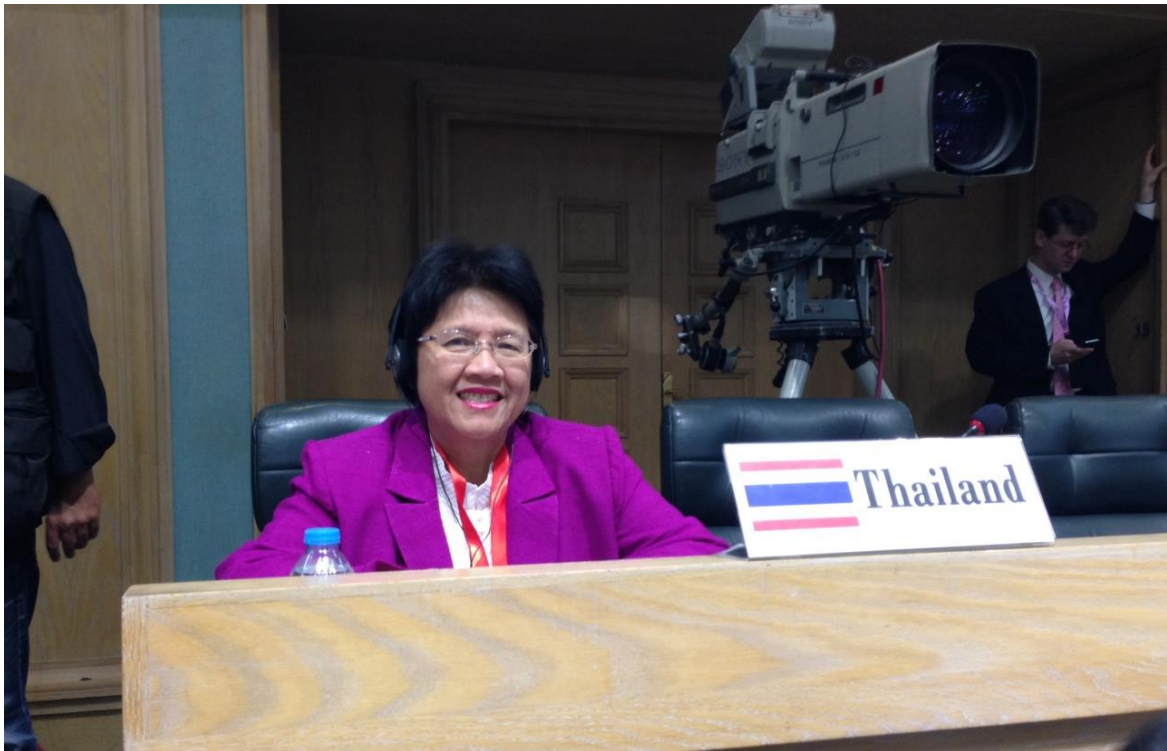
นางกาญจนารัตน์ ลีวีโรจน์ หัวหน้าคณะผู้แทนสถานิติบัญญัติแห่งชาติ ในระหว่างการกล่าวถ้อยแถลง

ในส่วนของประเทศไทย นางกาญจนารัตน์ ลีวีโรจน์ หัวหน้าคณะผู้แทนสถานิติบัญญัติแห่งชาติ ได้กล่าวถ้อยแถลงโดยมีสาระเกี่ยวกับผลการดำเนินงานของไทยในการส่งเสริมบทบาทสตรีในด้านต่าง ๆ โดยเฉพาะอย่างยิ่งในทางการเมือง สถานการณ์ปัจจุบันภายในประเทศไทยเกี่ยวกับการออกเสียงประชามติ ร่างรัฐธรรมนูญ ตลอดจนแสดงความขอบคุณในโอกาสการเข้าร่วมการประชุม WIP ในครั้งนี้ และกล่าวสนับสนุนให้สมาชิกรัฐสภาทั่วโลกให้เล็งเห็นความสำคัญของการส่งเสริมบทบาทสตรี