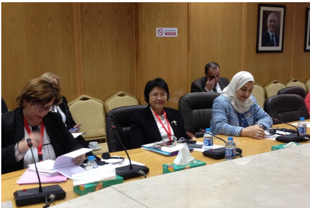
นางกาญจนารัตน์ สิวโรจน์ หัวหน้าคณะผู้แทนสถานิติบัญญัติแห่งชาติ ระหว่างการเข้าร่วมการอภิปรายคู่ขนาน หัวข้อ “การศึกษาาระบบและกระบวนการเลือกตั้ง”