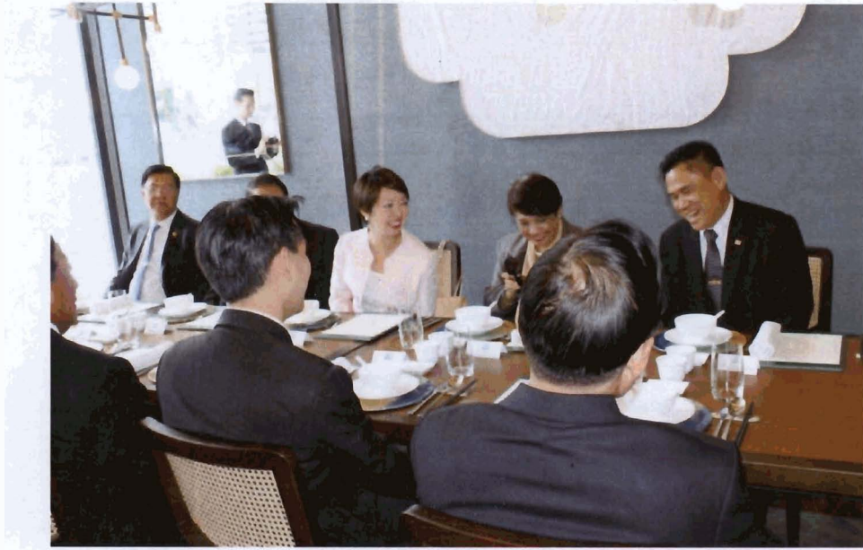
๕.๒ พลอากาศเอก ซาติ จันทรเรือง ประธานกลุ่มมิตรภาพฯ ไทย - สิงคโปร์ เป็น เจ้าภาพเลี้ยงรับรองอาหารค่ำเพื่อเป็นเกียรติแก่นายบรรสาน บุนนาค เอกอัครราชทูต ณ สิงคโปร์ ในวันอาทิตย์ที่ ๑๐ มกราคม ๒๕๕๙ เวลา ๑๘.๐๐ นาฬิกา ณ ภัตตาคาร Jumbo Seafood