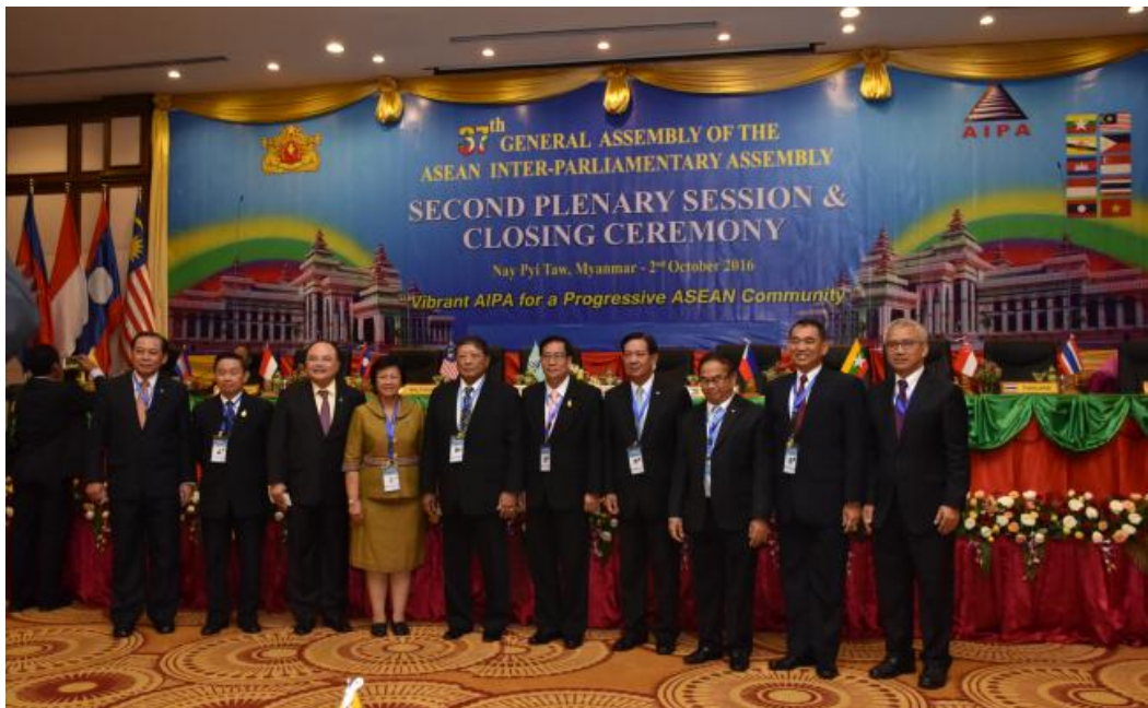
คณะผู้แทนสภานิติบัญญัติแห่งชาติร่วมพิธีลงนามในแถลงการณ์ร่วม