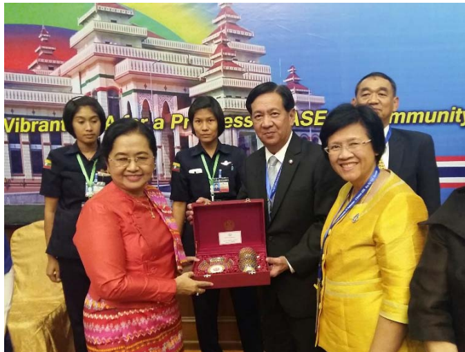
คณะผู้แทนสภานิติบัญญัติแห่งชาติ มอบของที่ระลึกแก่ประธานการประชุม WAIPA

ที่ประชุมให้การรับรองร่างข้อมติดังกล่าวอย่างเป็นทางการเป็นเอกฉันท์ เมื่อวันที่ ๑ ตุลาคม ๒๕๕๙ โดยมีการปรับเปลี่ยนถ้อยคำและเพิ่มเติมรายละเอียด ตามที่ประเทศสมาชิก AIPA เสนอเพื่อให้มีความสมบูรณ์ยิ่งขึ้น