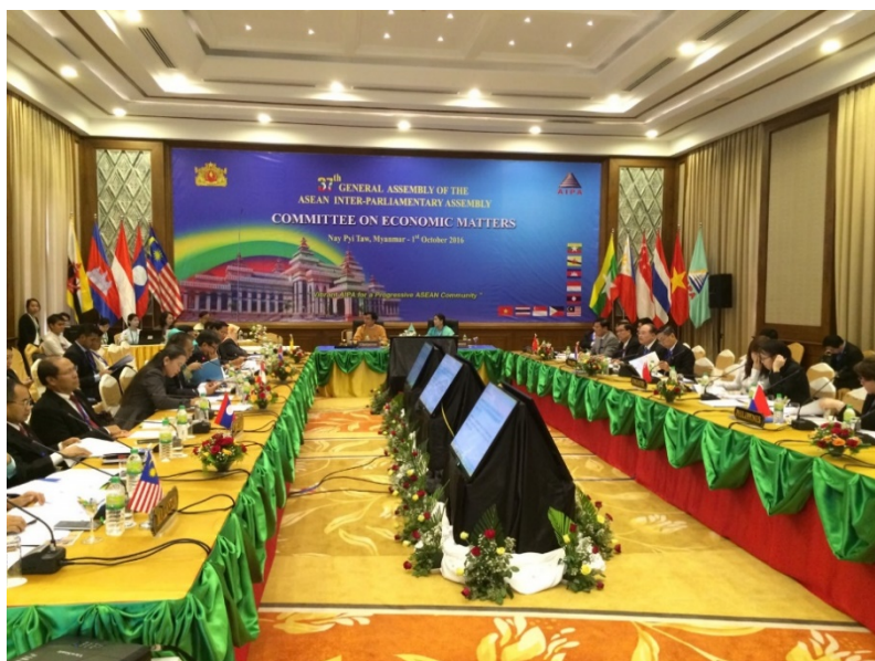
บรรยากาศการประชุมคณะกรรมการด้านเศรษฐกิจ

คณะผู้แทนสภานิติบัญญัติแห่งชาติสนับสนุนเนื้อหาและแนวทางการสร้างความร่วมมือตามร่างข้อมติฉบับดังกล่าว โดยตระหนักถึงบทบาทของฝ่ายไทยในฐานะประเทศผู้รับแรงงานจากประเทศเพื่อนบ้าน และให้ความสำคัญกับบทบาทของแรงงานข้ามชาติต่อการขับเคลื่อนเศรษฐกิจในปัจจุบัน โดยจัดระบบลงทะเบียนให้แรงงานข้ามชาติที่เข้ามาทำงานในประเทศเข้าสู่ระบบการขึ้นทะเบียนแรงงานอย่างถูกต้อง ทั้งหมดนี้เป็นไปตามกฎหมายภายในของประเทศซึ่งยึดหลักการคุ้มครองแรงงานตามแนวทางสากล