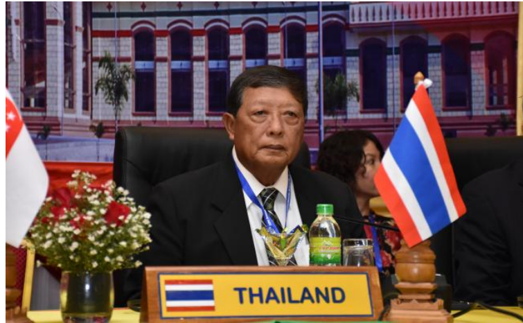
พลอากาศเอก ชาลี จันทร์เรือง สมาชิกสภานิติบัญญัติแห่งชาติ ปฏิบัติหน้าที่หัวหน้าคณะผู้แทนสภานิติบัญญัติแห่งชาติแทนรองประธานสภานิติบัญญัติแห่งชาติ คนที่สอง ช่วงพิธีลงนามในแถลงการณ์ร่วม