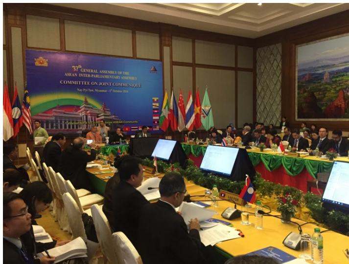
บรรยากาศในห้องประชุมคณะกรรมการร่างแถลงการณ์ร่วม

ทั้งนี้ ผู้แทนสภานิติบัญญัติแห่งชาติได้ร่วมตรวจสอบร่างแถลงการณ์ร่วม โดยเสนอให้แก้ไขถ้อยคำเพื่อความถูกต้อง พร้อมทั้งเพิ่มเติมประเด็นที่ยังไม่ครบถ้วน เพื่อความสมบูรณ์ของร่างแถลงการณ์ร่วม ก่อนที่จะนำเข้าสู่พิธีลงนามของหัวหน้าคณะในการประชุมเต็มคณะช่วงที่ ๒ เมื่อวันที่อาทิตย์ที่ ๓ ตุลาคม ๒๕๕๙ ทั้งนี้ พลอากาศเอก ชาลี จันท์เรือง สมาชิกสภานิติบัญญัติแห่งชาติ ปฏิบัติหน้าที่หัวหน้าคณะสภานิติบัญญัติ-แห่งชาติแทนรองประธานสภานิติบัญญัติแห่งชาติ คนที่สอง ร่วมพิธีลงนามในแถลงการณ์ร่วม