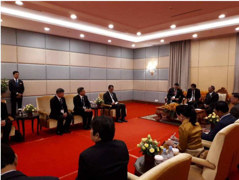
คณะผู้แทนฯ ไทยเข้าเยี่ยมคารวะประธานสภาแห่งชาติกัมพูชา