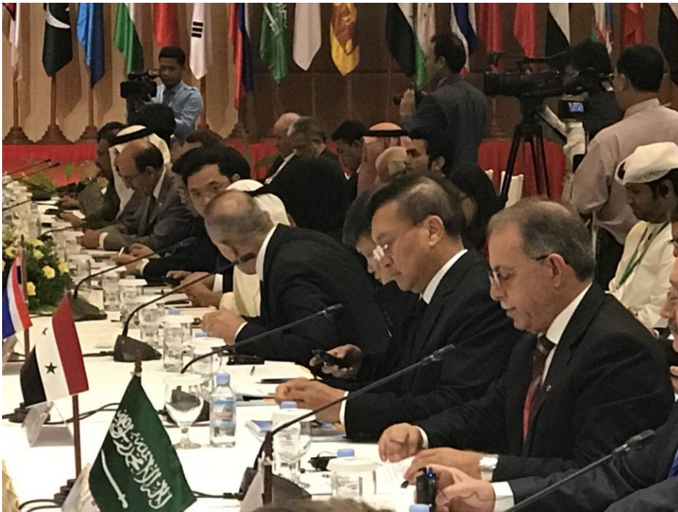
คณะผู้แทนฯ ใน APA เข้าร่วมการประชุมฯ