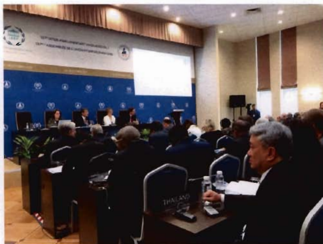
บรรยากาศภายในห้องประชุม