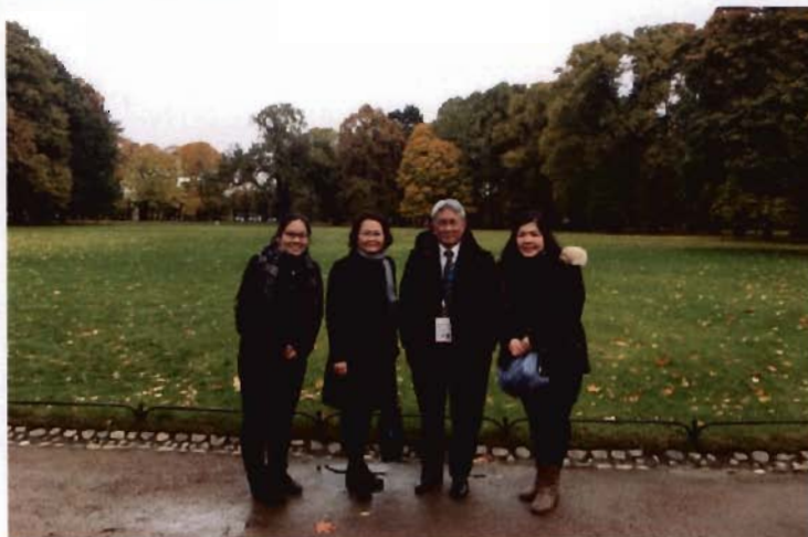
คณะผู้แทนไทยเข้าร่วมกิจกรรมทัศนศึกษาตามโปรแกรมวัฒนธรรมจัดโดยเจ้าภาพผู้จัดการประชุม

ประเทศเจ้าภาพผู้จัดการประชุมได้จัดให้มีการทัศนศึกษาตามโปรแกรมวัฒนธรรม ตลอดจนการให้ความรู้ด้านประวัติศาสตร์ของนครเซนต์ปีเตอ์สเบิร์ก อาทิ โบสถ์ Savior on Spilled Blood พิพิธภัณฑ์ศิลปะรัสเซีย ล่องเรือแม่น้ำ Neva พิพิธภัณฑ์ Stage Hermitage และชมการแสดงบัลเลต์ “Fairy Dolls” โดยผู้แสดงจากสถาบันบัลเลต์ Vaganova แก่คณะผู้แทนจากสมาคมเลขาธิการรัฐสภาตลอดทั้งวัน