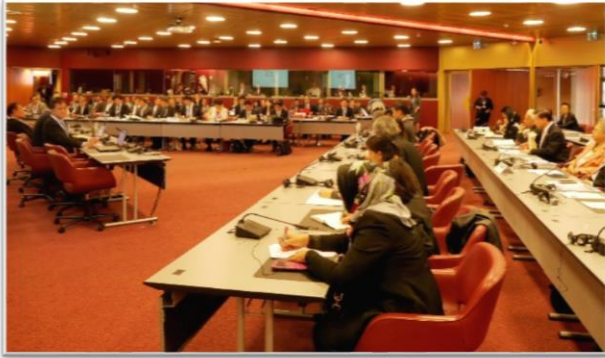
บรรยากาศระหว่างการประชุมกลุ่มภูมิรัฐศาสตร์เอเชีย-แปซิฟิก