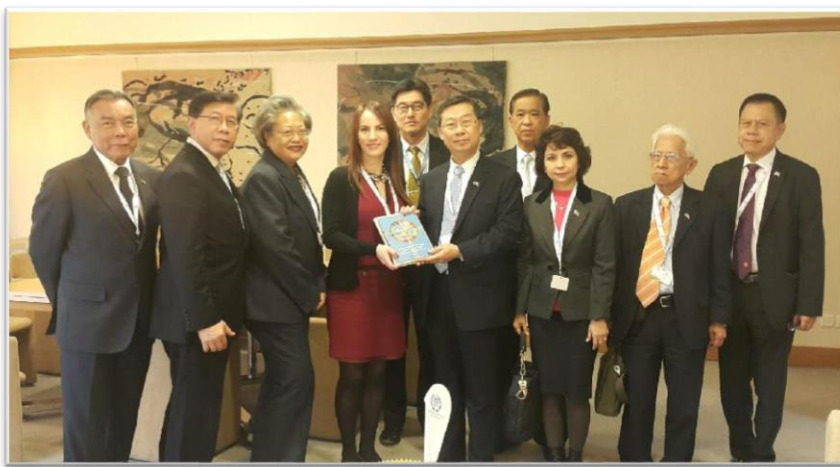
การพบปะหารือทวิภาคีระหว่างคณะผู้แทนสถานิติบัญญัติแห่งชาติฯ กับ Ms. Gabriela Cuevas Barron ประธานสหภาพรัฐสภา

(๓) ประธานสหภาพรัฐสภาได้แจ้งว่าสหภาพรัฐสภากำลังอยู่ในระหว่างพิจารณาปฏิรูปองค์กร โดยเฉพาะการกระจายบทบาทของการมีส่วนร่วมในการขับเคลื่อนกิจกรรมต่าง ๆ ของสหภาพรัฐสภาไปสู่รัฐสภาสมาชิกทุกประเทศให้มากขึ้น เพื่อให้สหภาพรัฐสภาเป็นองค์กรที่รัฐสภาสมาชิกมีบทบาทนำ และพัฒนาไปสู่การเป็นองค์กรระหว่างประเทศของรัฐสภาซึ่งเป็นตัวแทนพลเมืองของโลกอย่างแท้จริง