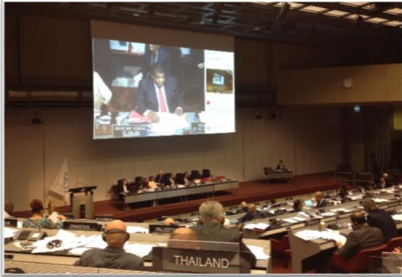
บรรยากาศระหว่างการประชุมคณะมนตรีบริหารสหภาพรัฐสภา ครั้งที่ ๒๐๒

ของคณะที่ปรึกษาฯ อนึ่ง คณะผู้แทนสถานิติบัญญัติแห่งชาติ ได้ลงมติร่วมกับที่ประชุมด้วยเสียงข้างมาก เห็นชอบให้คณะที่ปรึกษาฯ ปฏิบัติหน้าที่ได้ต่อไป จนถึงเดือนตุลาคม ๒๕๖๑ โดยให้ส่งขอบเขตการดำเนินงาน (Terms of Reference : TOR) ว่าด้วยอำนาจหน้าที่ของคณะที่ปรึกษาฯ ให้คณะกรรมการบริหารสหภาพรัฐสภา พิจารณาทบทวนต่อไป