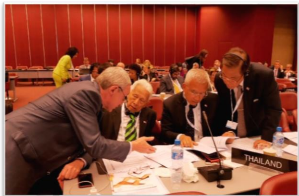
ผู้แทนรัฐสภารัสเซีย (ซ้าย) ขณะขอรับการสนับสนุนคำขอแก้ไขร่างข้อมติของตน จากคณะผู้แทนสภานิติบัญญัติแห่งชาติฯ