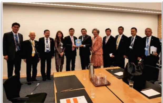
การพบปะหารือทวิภาคีระหว่างคณะผู้แทนสถานิติบัญญัติแห่งชาติฯ กับคณะผู้แทนสภาแห่งชาติเวียดนาม