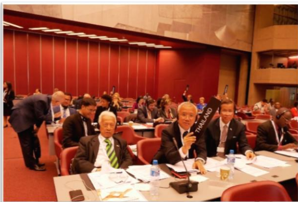
บรรยากาศระหว่างการลงมติรับรองคำขอแก้ไขร่างข้อมติเป็นรายบรรทัด

นอกจากนี้ ที่ประชุมได้รับฟังประเด็นจากผู้แทนรัฐสภาสมาชิกบางประเทศ เช่น ฟินแลนด์ เยอรมนี และฝรั่งเศส ซึ่งได้พยายามเสนอต่อที่ประชุมให้ควบรวมคำขอแก้ไขร่างข้อมติที่เกี่ยวข้องกับประเด็นด้านการเปลี่ยนแปลงสภาพภูมิอากาศเข้าด้วยกัน ที่ประชุมลงมติรับรองด้วยคะแนนท่วมท้นเช่นกัน