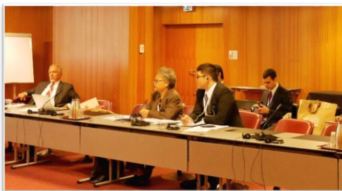
บรรยากาศระหว่างการประชุมกรรมการสิทธิมนุษยชนสหภาพรัฐสภาว่าด้วยกิจการสหประชาชาติ

ในช่วงท้าย ที่ประชุมได้พิจารณาระเบียบวาระการประชุมของคณะกรรมการสิทธิมนุษยชนสหภาพรัฐสภาว่าด้วยกิจการสหประชาชาติ ในการประชุมสมัชชาสหภาพรัฐสภา ครั้งที่ ๑๓๙ และการประชุมอื่น ๆ ที่เกี่ยวข้อง โดยมีข้อเสนอให้จัดการอภิปรายเกี่ยวกับประเด็นต่าง ๆ ประกอบด้วย การทบทวนการลดอาวุธในกรอบของสหประชาชาติ การปฏิรูประบบสหประชาชาติ ปัญหาเงินอุดหนุนเพื่อสนับสนุนสหประชาชาติ และการประสานงานระหว่างหน่วยชำนาญพิเศษภายในระบบสหประชาชาติเพื่อการดำเนินการตามเป้าหมายการพัฒนาที่ยั่งยืน