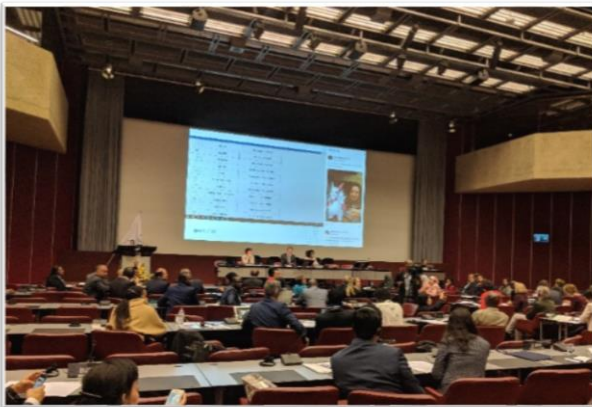
บรรยากาศระหว่างการประชุมคณะกรรมการสิทธิมนุษยชน รัฐสภาว่าด้วยประชาธิปไตยและสิทธิมนุษยชน

ที่ประชุมได้พิจารณาข้อเสนอในการจัดการอภิปราย (Panel discussion) ว่าด้วยบทบาทของ รัฐสภาในการจัดการเลือกปฏิบัติโดยเพศวิถีและอัตลักษณ์ทางเพศ และการสร้างหลักประกันต่อการเคารพ สิทธิมนุษยชนของกลุ่มผู้มีความหลากหลายทางเพศ (The role of parliaments in ending discrimination based on sexual orientation and gender identity, and ensuring respect for the human rights of LGBTI persons) เสนอโดยรัฐสภาเบลเยียม ซึ่งสืบเนื่องจากมติของที่ประชุมสมัชชาสหภาพรัฐสภา ครั้งที่ ๑๓๗ เมื่อเดือนตุลาคม ๒๕๖๐ ได้เสนอให้คณะกรรมการฯ นำข้อเสนอในการจัดการอภิปรายว่าด้วยหัวข้อ ดังกล่าว กลับมาพิจารณาทบทวนอีกครั้งในการประชุมครั้งนี้ ทั้งนี้ ภายหลังเสร็จสิ้นการอภิปรายซึ่งได้รับทราบ ความเห็นอย่างกว้างขวางแล้ว ที่ประชุม รวมถึงคณะผู้แทนสถานิติบัญญัติแห่งชาติฯ ได้ลงมติรับรองข้อเสนอ ในการจัดการอภิปรายว่าด้วยหัวข้อดังกล่าว ด้วยคะแนน ๓๑ เสียง ต่อ ๒๔ เสียง โดยที่ประชุมมีมติเห็นชอบการ- จัดการอภิปรายว่าด้วยหัวข้อดังกล่าว ในการประชุมคณะกรรมการฯ ครั้งต่อไป