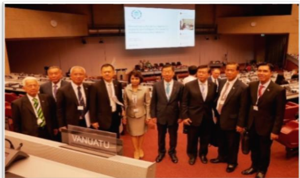
คณะผู้แทนสภานิติบัญญัติแห่งชาติฯ บันทึกภาพร่วมกันเป็นที่ระลึก