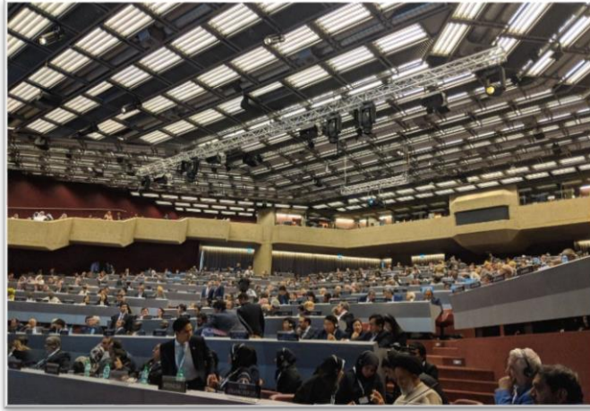
บรรยากาศภายในที่ประชุมสมัชชาสหภาพรัฐสภา ครั้งที่ ๑๓๘ ระหว่างการอภิปรายทั่วไป