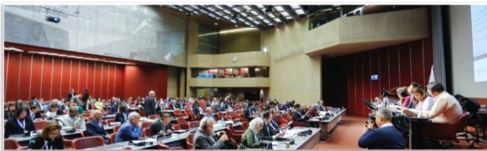
บรรยากาศระหว่างการประชุมคณะกรรมการสามัญสหภาพรัฐสภาว่าด้วยสันติภาพและความมั่นคงระหว่างประเทศ

จากนั้น เวลา ๑๔.๓๐ – ๑๗.๓๐ นาฬิกา ต่อเนื่องถึงวันจันทร์ที่ ๒๖ มีนาคม ๒๕๖๑ เวลา ๐๙.๓๐ – ๑๒.๓๐ นาฬิกา การประชุมคณะกรรมการฯ ได้จัดขึ้นเป็นวาระที่สอง โดยมีระเบียบวาระการพิจารณาร่างข้อมติ ตามคำขอแก้ไขร่างข้อมติจากรัฐสภาสมาชิกรวม ๑๓๒ ข้อ พร้อมด้วยคำขอแก้ไขร่างข้อมติจากการประชุมสหภาพรัฐสภาสตรี และคำขอแก้ไขร่างข้อมติจากผู้ร่วมเสนอรายงาน ซึ่งผนวกเนื้อหาจากคำขอแก้ไขร่างข้อมติโดยรัฐสภาสมาชิกเพื่อให้สอดคล้องตลอดทั้งฉบับ ครอบคลุมเนื้อหาตั้งแต่วรรคนำไปจนถึงวรรคปฏิบัติการ ทั้งนี้ คณะผู้แทนสถานิติบัญญัติแห่งชาติฯ ได้ร่วมในกระบวนการดังกล่าว โดยจัดทำและเสนอคำขอแก้ไขร่างข้อมติ จำนวน ๕ ข้อ ตามระยะเวลาที่กำหนด คือ ภายในวันที่ ๙ มีนาคม ๒๕๖๑ เช่นกัน คณะผู้แทนสถานิติบัญญัติแห่งชาติฯ จึงมีภารกิจในการอภิปรายเหตุผลของการจัดทำข้อเสนอขอแก้ไขร่างข้อมติต่อที่ประชุมด้วย