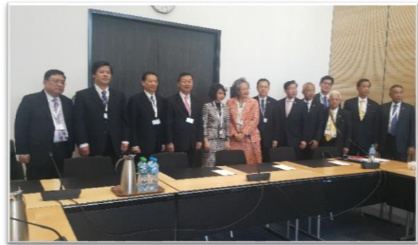
การพบปะหารือทวิภาคีระหว่างคณะผู้แทนสภานิติบัญญัติแห่งชาติฯ กับคณะผู้แทนสภาประชาชนแห่งชาติจีน