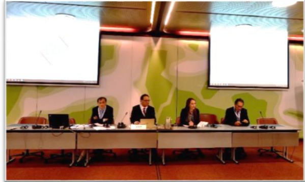
Mr. Wesley Simina ประธานรัฐสภาไมโครนีเซีย (ที่สองจากซ้าย) ขณะปฏิบัติหน้าที่ประธานการประชุมกลุ่มภูมิรัฐศาสตร์เอเชีย-แปซิฟิก โดยมี Ms. Gabriela Cuevas Barron ประธานสหภาพรัฐสภา (ที่สามจากซ้าย) ให้เกียรติเข้าร่วมการประชุมด้วย