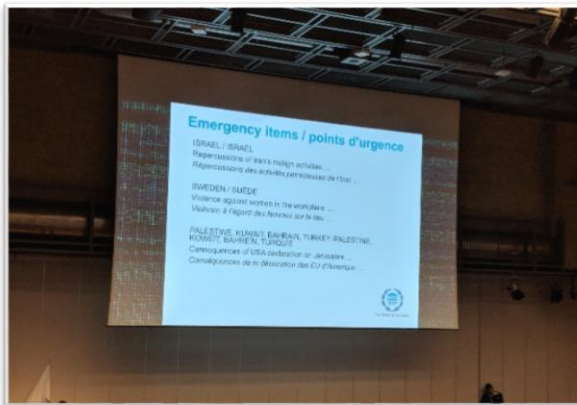
ระเบียบวาระเร่งด่วนทั้ง ๓ หัวข้อ จากข้อเสนอของรัฐสภาสมาชิก

ต่อมา เมื่อเวลา ๑๗.๐๐ – ๑๘.๓๐ นาฬิกา เป็นการพิจารณาระเบียบวาระเร่งด่วน (Emergency item) ซึ่งประธานสหภาพรัฐสภาได้แจ้งต่อที่ประชุมว่า สหภาพรัฐสภาได้รับข้อเสนอระเบียบวาระเร่งด่วน จำนวน ๓ หัวข้อ จาก (๑) อิสราเอล (๒) สวีเดน และ (๓) ข้อเสนอร่วมของปาเลสไตน์ คูเวต บาห์เรน และตุรกี ซึ่งผ่านเกณฑ์ได้รับคะแนนเสียงสนับสนุนเกิน ๒ ใน ๓ ของที่ประชุม ตามข้อบังคับการประชุมสมัชชาสหภาพรัฐสภา แต่เนื่องจากในการประชุมสมัชชาสหภาพรัฐสภาครั้งหนึ่งจะสามารถบรรจุระเบียบวาระเร่งด่วนได้เพียง ๑ หัวข้อ ที่ประชุมจึงต้องลงมติเลือกระเบียบวาระเร่งด่วนโดยฝ่ายเลขานุการการประชุมขานรายนามที่ละประเทศ ซึ่งคณะผู้แทนสถานทูตไทยได้ร่วมลงมติเลือกหัวข้อระเบียบวาระเร่งด่วนดังกล่าวด้วย ทั้งนี้ ผลการลงมติปรากฏว่า ข้อเสนอร่วมของปาเลสไตน์ คูเวต บาห์เรน และตุรกี หัวข้อ “ผลสืบเนื่องจากกรณีสหรัฐอเมริกาประกาศรับรองนครเยรูซาเล็มเป็นเมืองหลวงของอิสราเอล และสิทธิของชาวปาเลสไตน์ในนครเยรูซาเล็มในบริบทของกฎบัตรและข้อมติของสหประชาชาติ (The consequences of the US declaration on Jerusalem and the rights of the Palestinian people in Jerusalem in the light of the UN Charter and resolutions)” ได้รับเลือกให้เป็นระเบียบวาระเร่งด่วนด้วยคะแนนเสียงเห็นชอบ (Affirmative votes) สูงสุด ๘๔๓ คะแนน โดยจะเริ่มการอภิปรายเพื่อจัดทำร่างข้อมติในหัวข้อดังกล่าว ในการประชุมสมัชชาสหภาพรัฐสภา ครั้งที่ ๑๓๘ ในวันถัดไป