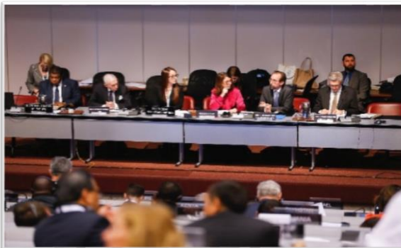
บรรยากาศระหว่างการประชุมสมัชชาสหภาพรัฐสภา ครั้งที่ ๑๓๘

ในวันอาทิตย์ที่ ๒๕ มีนาคม ๒๕๖๑ เวลา ๑๑.๐๐ – ๑๗.๐๐ นาฬิกา ณ ห้องประชุมหมายเลข ๑ ชั้น ๑ การประชุมสมัชชาสหภาพรัฐสภา ครั้งที่ ๑๓๘ ได้เริ่มต้นขึ้นอย่างเป็นทางการ ภายใต้หัวข้อหลักของการอภิปรายทั่วไป (General Debate) เรื่อง “การเสริมสร้างระบบการบริหารจัดการระดับโลกในกรณีผู้โยกย้ายถิ่นฐานและผู้ลี้ภัย : ความจำเป็นในการจัดทำนโยบายที่ยึดหลักฐานเชิงประจักษ์ (Strengthening the global regime for migrants and refugees : the need for evidence – based policy solutions)” ในช่วงแรก ที่ประชุมได้รับเกียรติจากองค์ปาฐกรับเชิญ (Special guest speakers) ซึ่งเป็นผู้แทนองค์การระหว่างประเทศที่มีภารกิจเกี่ยวกับประเด็นการอพยพโยกย้ายถิ่นฐาน ได้แก่ (๑) Mr. William Lacy Swing เลขาธิการองค์การระหว่างประเทศเพื่อการโยกย้ายถิ่นฐาน (International Organization for Migration : IOM) (๒) เจ้าชาย Zeid Ra’ad Al Hussein ข้าหลวงใหญ่สิทธิมนุษยชนแห่งสหประชาชาติ (United Nations High Commissioner for Human Rights) และ (๓) Mr. Filippo Grandi ข้าหลวงใหญ่ผู้ลี้ภัยแห่งสหประชาชาติ (United Nations High Commissioner for Refugees) ร่วมกล่าวอภิปราย โดยมี Ms. Gabriela Cuevas Barron ประธานสหภาพรัฐสภา และ Mr. Martin Chungong เลขาธิการสหภาพรัฐสภา ทำหน้าที่กำกับการประชุม จากนั้น ที่ประชุมได้รับฟังผู้แทนรัฐสภาสมาชิกขึ้นกล่าวอภิปรายทั่วไปตามลำดับที่จัดไว้ โดยเริ่มจากผู้กล่าวถ้อยแถลงที่เป็นบุคคล ซึ่งดำรงตำแหน่งประธานรัฐสภา (High – Level Segment of the General Debate)