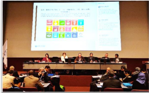
บรรยากาศระหว่างการประชุมคณะกรรมการสามัญสหภาพ รัฐสภาว่าด้วยกิจการสหประชาชาติ