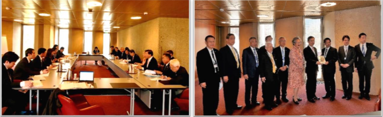
การพบปะหารือทวิภาคีระหว่างคณะผู้แทนสภานิติบัญญัติแห่งชาติ กับคณะผู้แทนรัฐสภาญี่ปุ่น

(๔) เนื่องจากประเทศไทยจะเป็นเจ้าภาพจัดการประชุมรัฐสภาระหว่างประเทศหลายรายการในระหว่างปี ๒๕๖๑ – ๒๕๖๒ และจะเป็นประธานอาเซียน ในปี ๒๕๖๒ ฝ่ายไทยจึงได้เชิญชวนให้ฝ่ายญี่ปุ่นส่งคณะผู้แทนเข้าร่วมการประชุมดังกล่าวด้วย เพื่อเสริมสร้างความร่วมมือระหว่างกันโดยเฉพาะในภาคนิติบัญญัติ ตลอดจนการยกระดับความสัมพันธ์ระหว่างญี่ปุ่นกับอาเซียน