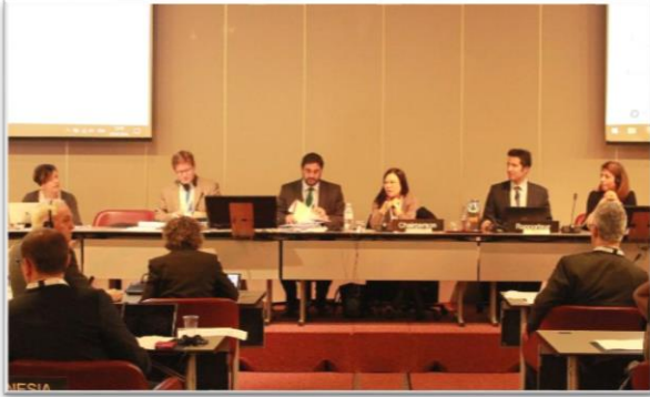
บรรยากาศระหว่างการประชุมคณะกรรมการสามัญสหภาพ รัฐสภาว่าด้วยสันติภาพและความมั่นคงระหว่างประเทศ