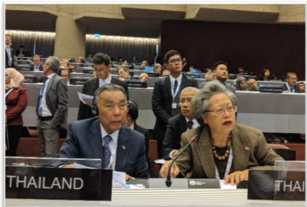
คณะผู้แทนสถานทูตไทยขณะลงมติระเบียบวาระเร่งด่วน

ในวันจันทร์ที่ ๒๖ มีนาคม ๒๕๖๑ การประชุมสมัชชาสหภาพรัฐสภา ครั้งที่ ๑๓๘ มีขึ้นเป็นวันที่สอง โดยระหว่างเวลา ๐๙.๐๐ – ๑๐.๓๐ นาฬิกา เป็นการอภิปรายเพื่อจัดทำร่างข้อมติระเบียบวาระเร่งด่วน หัวข้อ “ผลสืบเนื่องจากกรณีสหรัฐอเมริกาประกาศรับรองนครเยรูซาเล็มเป็นเมืองหลวงของอิสราเอล และสิทธิของชาวปาเลสไตน์ในนครเยรูซาเล็มในบริบทของกฎบัตรและข้อมติของสหประชาชาติ (The consequences of the US declaration on Jerusalem and the rights of the Palestinian people in Jerusalem in the light of the UN Charter and resolutions)”