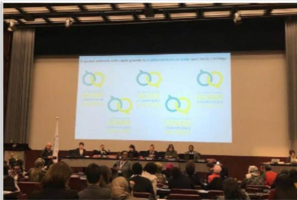
บรรยากาศระหว่างการประชุมสหภาพรัฐสภาสตรี ครั้งที่ ๒๗

ข้อเท็จจริงที่น่าสนใจอีกประการหนึ่งเกี่ยวกับจำนวนประชากรของโลก ซึ่งพบว่าเกือบทุกประเทศในโลกมีจำนวนประชากรหญิงมากกว่าชาย เช่นเดียวกับจำนวนผู้มีสิทธิเลือกตั้งในแต่ละประเทศ ซึ่งเป็นหญิงมากกว่าชาย แต่เมื่อจัดการเลือกตั้ง ปรากฏว่าผู้มีสิทธิเลือกตั้งที่เป็นชายส่วนใหญ่ลงคะแนนเสียงให้กับผู้สมัครชาย แต่ผู้มีสิทธิเลือกตั้งที่เป็นหญิงกลับไม่ได้ลงคะแนนเสียงให้ผู้สมัครหญิงด้วยกัน จึงอาจสะท้อนได้ว่าคนส่วนใหญ่เห็นว่าบทบาททางการเมืองเหมาะสมกับผู้ชาย โดยผู้หญิงอาจทำหน้าที่ได้ดีกว่าในด้านการดูแลครอบครัว จึงทำให้สัดส่วนของสตรีในทางการเมืองมีจำนวนน้อยอย่างไม่ต้องสงสัย