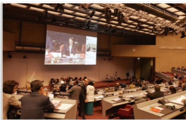
บรรยากาศระหว่างการประชุมคณะมนตรีบริหารสหภาพรัฐสภา ครั้งที่ ๒๐๒

ในวันอาทิตย์ที่ ๒๕ มีนาคม ๒๕๖๑ เวลา ๐๙.๐๐ – ๑๑.๐๐ นาฬิกา ณ ห้องประชุมหมายเลข ๑ ชั้น ๑ คณะผู้แทนสถานทูตไทยประจำสหประชาชาติฯ เข้าร่วมการประชุมคณะมนตรีบริหารสหภาพรัฐสภา ครั้งที่ ๒๐๒ (วาระที่หนึ่ง) ที่ประชุมได้รับทราบรายงานจาก Ms. Gabriela Cuevas Barron ประธานสหภาพรัฐสภา เกี่ยวกับกิจกรรมต่าง ๆ ในขณะที่ยังดำรงตำแหน่ง นับแต่การประชุมคณะมนตรีบริหารสหภาพรัฐสภา ครั้งที่ ๒๐๑ เมื่อเดือนตุลาคม ๒๕๖๐ เป็นต้นมา และจาก Mr. Martin Chungong เลขาธิการสหภาพรัฐสภา เกี่ยวกับรายงานภาพรวมผลการดำเนินงานของสหภาพรัฐสภา ประจำปี ๒๕๖๐ จากนั้น ที่ประชุมได้รับทราบรายงานสถานะด้านการเงินและงบประมาณของสหภาพรัฐสภา ประจำปี ๒๕๖๐ โดยคณะอนุกรรมการด้านการเงิน (Sub – Committee on Finance)