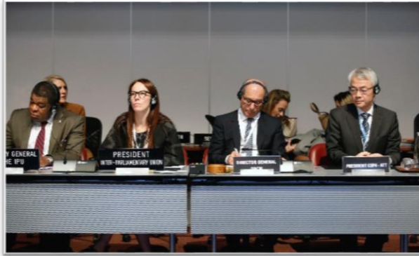
บรรยากาศระหว่างการประชุมสมัชชาสหภาพรัฐสภา ครั้งที่ ๑๓๘ ในช่วงการอภิปรายพิเศษ หัวข้อ “มหันตภัยจากอาวุธที่มีอานุภาพทำลายล้างสูง”

ผู้แทนสมานิติบัญญัติแห่งชาติฯ ได้กล่าวแสดงความคิดเห็นต่อที่ประชุมว่า ประเทศไทยไม่ได้คัดค้านหรือตั้งข้อสงวนต่อร่างข้อมติระเบียบวาระเร่งด่วน หากแต่ต้องการยืนยันท่าทีของไทยที่ดำรงมาอย่างยาวนาน ในการสนับสนุนทางออกแบบ ๒ รัฐ (Two – state solution) ของเลขธิการสหประชาชาติ ต่อกรณีนครเยรูซาเล็ม ซึ่งรวมถึงข้อมติของคณะมนตรีความมั่นคงแห่งสหประชาชาติและกฎหมายระหว่างประเทศต่าง ๆ ที่เกี่ยวข้องด้วย