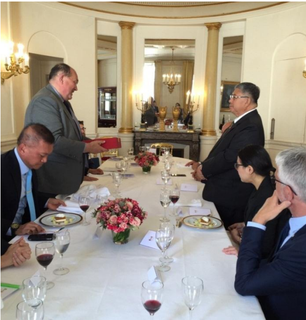
๖.๓ กลุ่มมิตรภาพฝรั่งเศส-ไทย สภาผู้แทนราษฎรฝรั่งเศส เป็นเจ้าภาพเลี้ยงอาหารกลางวันแก่คณะ เมื่อวันที่ ๓๐ พฤษภาคม ๒๕๖๑ เวลา ๑๓.๐๐ นาฬิกา ณ ห้องอาหารสมาชิกสภาผู้แทนราษฎร กรุงปารีส