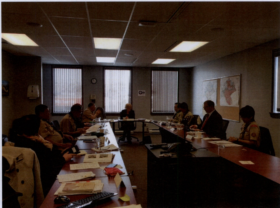
คณะผู้แทนสถานิติบัญญัติแห่งชาติ กล่าวรายงานต่อที่ประชุม

ที่ประชุมฯ ได้หารือเกี่ยวกับการเตรียมการด้านต่าง ๆ ของประเทศไทย ในการเป็นเจ้าภาพ จัดการประชุมสมัชชาใหญ่สหภาพลูกเสือรัฐสภาโลก ครั้งที่ ๙ โดยประเทศไทยได้รายงานความคืบหน้า ดังนี้