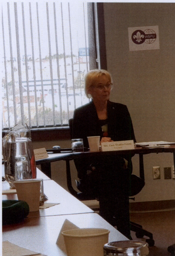
นางสาว Eva Thalén FINNÉ ประธานสหภาพลูกเสือรัฐสภาโลก

ทั้งนี้ นางสาว Eva Thalén FINNÉ ได้กล่าวถึงประเด็นที่ได้รับความสนใจจากสมาชิกรัฐสภาทั่วโลกในการประชุมสหภาพรัฐสภาโลก ครั้งที่ ๑๓๘ (The 138 th Inter-Parliamentary Union-IPU) ณ สมาพันธรัฐสวิส อาทิ สิทธิมนุษยชน ความเท่าเทียมทางเพศ และประเด็นปัญหาสำคัญอื่น ๆ ของโลก ในกรอบการพัฒนาที่ยั่งยืน โดยในประเด็นดังกล่าวนี้ สวีเดนส่งเสริมการมีส่วนร่วมและการรับฟังความคิดเห็นของเยาวชนเป็นสำคัญ