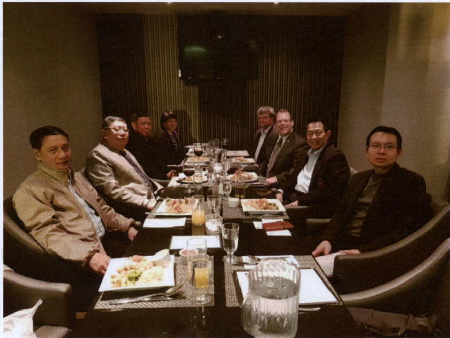
คณะผู้แทนสถานิติบัญญัติแห่งชาติเข้าร่วมงานเลี้ยงอาหารค่ำ