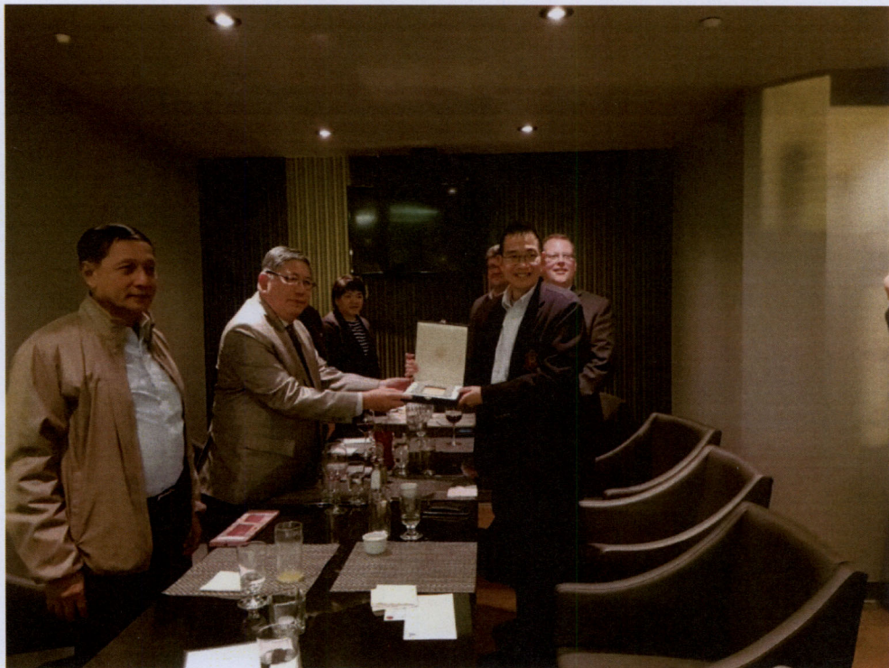
คณะผู้แทนสถานิติบัญญัติแห่งชาติ มอบของที่ระลึกให้แก่เอกอัครราชทูต ณ กรุงออตตาวา