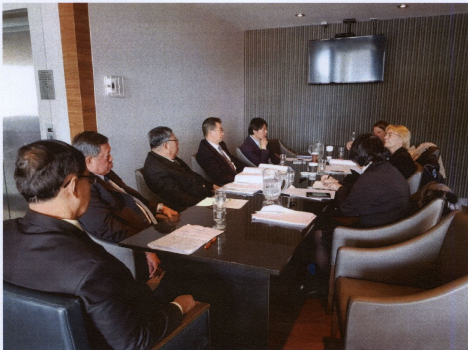
คณะผู้แทนสถานิติบัญญัติแห่งชาติ เข้าร่วมการพบปะหารือกับประธานสหภาพลูกเสือรัฐสภาโลก