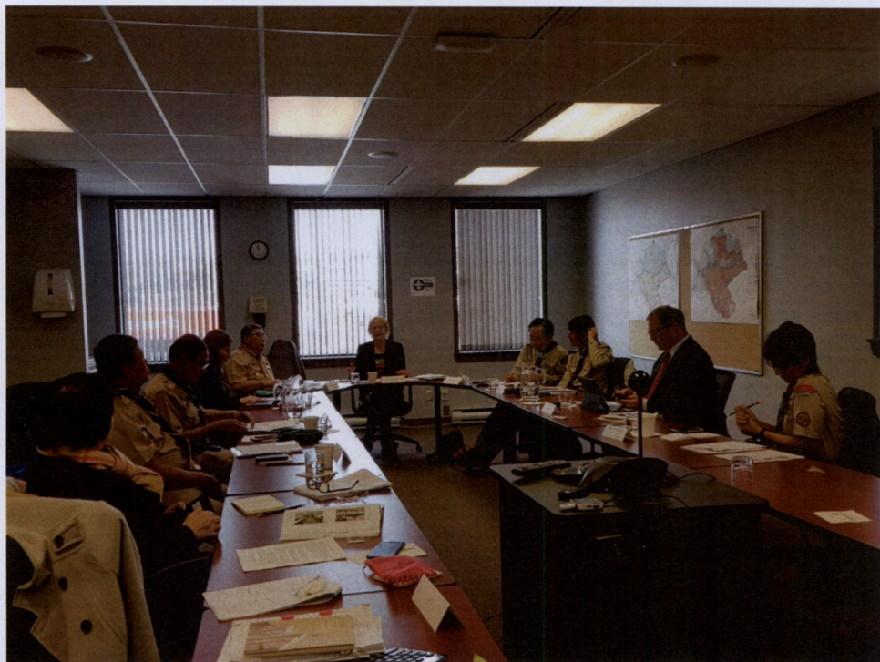
คณะผู้แทนสภานิติบัญญัติแห่งชาติ

ทั้งนี้ ประธานสภานิติบัญญัติแห่งชาติได้แต่งตั้ง นายมาริช เสงี่ยมพงษ์ เอกอัครราชทูต ณ กรุงออตตาวา ปฏิบัติหน้าที่ที่ปรึกษาคณะผู้แทนสภานิติบัญญัติแห่งชาติในระหว่างการประชุม