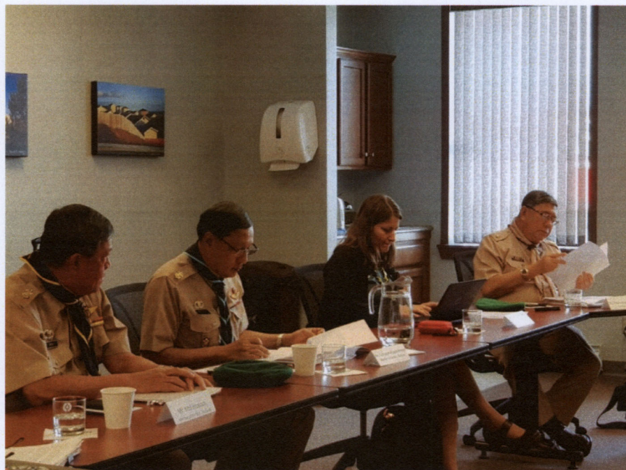
คณะผู้แทนสภานิติบัญญัติแห่งชาติกล่าวรายงานต่อที่ประชุม

สำหรับบทบาทของสหภาพลูกเสือรัฐสภาโลกในเวทีระหว่างประเทศนั้น เห็นควรมุ่งเน้นไปยังเวทีสากลของรัฐสภา อาทิ การประชุมสหภาพรัฐสภา ซึ่งจัดการประชุมขึ้นทุกปี เสริมสร้างความเข้าใจกับหน่วยงานในชาติเรื่องบทบาทของสหภาพลูกเสือรัฐสภาโลก รวมถึงสร้างความเข้าใจเพิ่มเติมให้แก่องค์กรลูกเสือโลกว่า จะได้รับประโยชน์จากการร่วมมือกับสหภาพลูกเสือรัฐสภาโลกอย่างไร