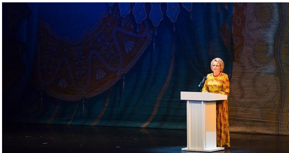
นาง Valentina Matvienko ประธานสภาสหพันธ์แห่งสหพันธรัฐรัสเซีย กล่าวเปิดงานคอนเสิร์ตกาลา สำหรับผู้เข้าร่วมการประชุม Eurasian Women's Forum ครั้งที่ ๒ เมื่อวันที่ ๑๙ กันยายน ๒๕๖๑