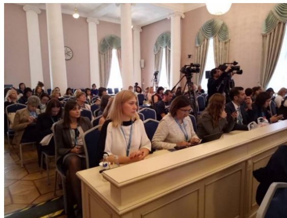
ภาพบรรยากาศการเข้าร่วมประชุมกลุ่มย่อยเรื่อง "สตรีกับการเติบโตทางเศรษฐกิจอย่างสมดุล" เมื่อวันที่ ๒๐ กันยายน ๒๕๖๑