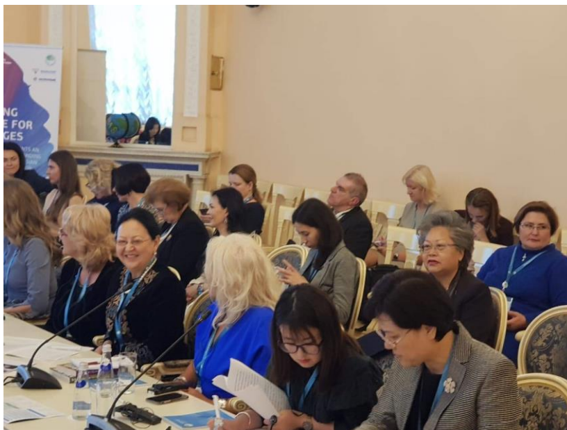
นางพิไลพรรณ สมบัติศิริ หัวหน้าคณะผู้แทนสถานิติบัญญัติแห่งชาติ เข้าร่วมการประชุมกลุ่มย่อยเรื่อง "สตรีกับความก้าวหน้าทางสังคม" เมื่อวันที่ ๒๐ กันยายน ๒๕๖๑