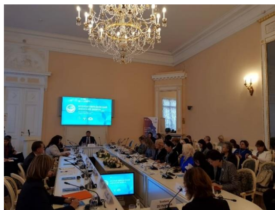
ภาพบรรยากาศการประชุมกลุ่มย่อยเรื่อง "สตรีกับความก้าวหน้าทางสังคม" เมื่อวันที่ ๒๐ กันยายน ๒๕๖๑