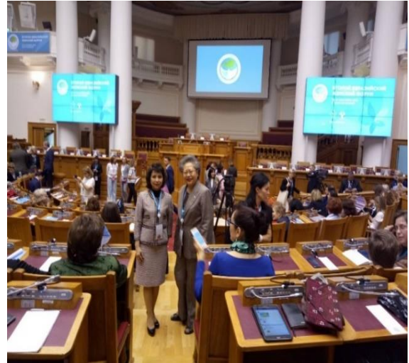
คณะผู้แทนสภานิติบัญญัติแห่งชาติ เข้าร่วมพิธีเปิดการประชุม Eurasian Women's Forum ครั้งที่ ๒