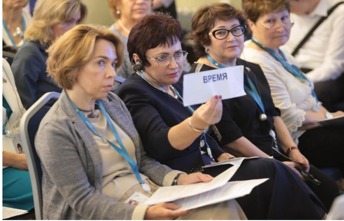
บรรยากาศการอภิปรายของผู้เข้าร่วมประชุมในการประชุมกลุ่มย่อย เรื่อง “การมีอายุยืนยาวอย่างมีคุณภาพ – ความล้ำหน้าของเทคโนโลยีและความริเริ่มของสตรี”