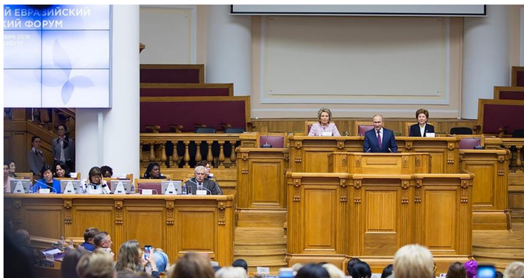
นาย Vladimir Putin ประธานาธิบดีรัสเซีย กล่าวสุนทรพจน์ในพิธีเปิดการประชุม Eurasian Women's Forum ครั้งที่ ๒ เมื่อวันที่ ๒๐ กันยายน ๒๕๖๑