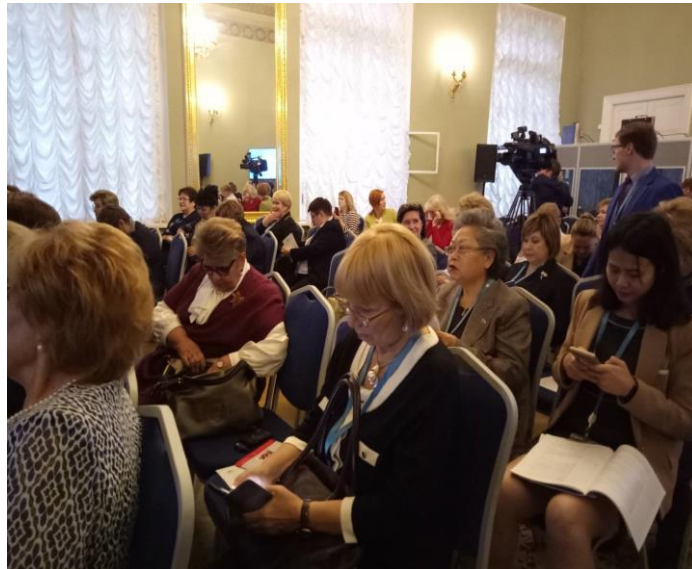
บรรยากาศการประชุมกลุ่มย่อย เรื่อง “การมีอายุยืนยาวอย่างมีคุณภาพ – ความล้ำหน้าของเทคโนโลยีและความริเริ่มของสตรี”

นอกจากนี้ ที่ประชุมยังมีการอภิปรายอย่างกว้างขวางเกี่ยวกับการใช้เทคโนโลยีทางการแพทย์สมัยใหม่เพื่อช่วยผู้สูงอายุให้ใช้ชีวิตอย่างมีคุณภาพ รวมถึงการทำงานอดิเรก เล่นกีฬา ท่องเที่ยวและใช้ชีวิตในชนบทของผู้สูงอายุ การจ้างงานผู้สูงอายุ การดูแลโดยภาครัฐที่เกี่ยวข้องไปกับการจัดงบประมาณที่เหมาะสมและการใช้เทคโนโลยีสมัยใหม่เพื่อลดช่องว่างระหว่างวัย ซึ่งล้วนช่วยให้ผู้สูงอายุมีชีวิตอยู่อย่างมีความสุขและไม่กังวลว่าจะเป็นภาระของสังคม