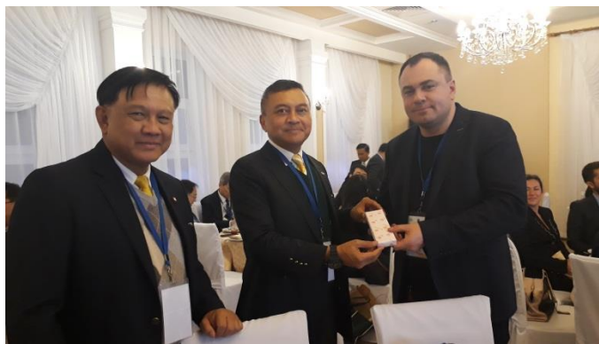
พลเอก นิพัทธ์ ทองเล็ก สมาชิกสถานิติบัญญัติแห่งชาติ และพลเรือเอก อมรเทพ ฒ บางช้าง สมาชิกสถานิติบัญญัติแห่งชาติ มอบของที่ระลึกแก่เจ้าหน้าที่ประจำคณะผู้แทนไทยจากสภาผู้แทนราษฎรสหพันธรัฐรัสเซีย

คณะผู้แทนสถานิติบัญญัติแห่งชาติ นำโดย พลเอก นิพัทธ์ ทองเล็ก พร้อมด้วย พลเรือเอก อมรเทพ ฒ บางช้าง สมาชิกสถานิติบัญญัติแห่งชาติ ได้ปฏิบัติหน้าที่ในการเข้าร่วมประชุมเป็นอย่างดี และติดตามประเด็นการอภิปรายในที่ประชุมทุกประเด็น รวมทั้งได้ประสานความร่วมมือในระดับทวิภาคีเกี่ยวกับกลุ่มมิตรภาพสมาชิกรัฐสภาไทย ซึ่งเป็นการสนับสนุนความร่วมมือและการสร้างเครือข่ายด้านรัฐสภา นอกจากนี้ คณะผู้แทนฯ ได้พบปะหารือกับผู้แทนรัฐสภาสมาชิกของ APA ที่เข้าร่วมการประชุมในประเด็นต่าง ๆ เช่น ความสัมพันธ์ระหว่างประเทศ และการจัดตั้งสถานเอกอัครราชทูตต่างประเทศประจำประเทศไทย และในโอกาสนี้ พลเอก นิพัทธ์ ทองเล็ก ได้กล่าวขอบคุณคณะผู้แทนรัฐสภาสมาชิกของ APA ที่เข้าร่วมการประชุมคณะกรรมการว่าด้วยสังคมและวัฒนธรรมในโอกาสที่รัฐสภาไทยเป็นเจ้าภาพจัดการประชุมฯ ในช่วงระหว่างวันที่ ๑๒ - ๑๕ กุมภาพันธ์ ๒๕๖๒ ณ กรุงเทพมหานคร และในโอกาสเดียวกันนี้ คณะผู้แทนฯ ได้ร่วมถ่ายภาพหมู่และมอบของที่ระลึกแก่ประธานการประชุมฯ