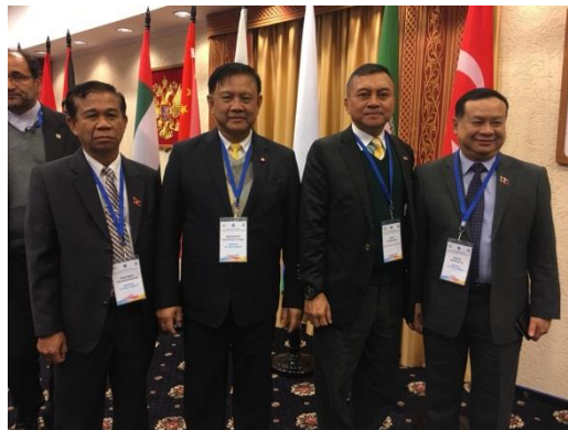
คณะผู้แทนไทยถ่ายภาพร่วมกับคณะผู้แทนลาว ในโอกาสการประชุมการประชุมคณะกรรมการว่าด้วยเศรษฐกิจและการพัฒนาที่ยั่งยืนของสมัชชารัฐสภาเอเชีย ณ ศูนย์วัฒนธรรมและธุรกิจ เมืองนาร์ยาน-มาร์ (Naryan-Mar) สหพันธรัฐรัสเซีย วันศุกร์ที่ ๑๙ เมษายน ๒๕๖๒