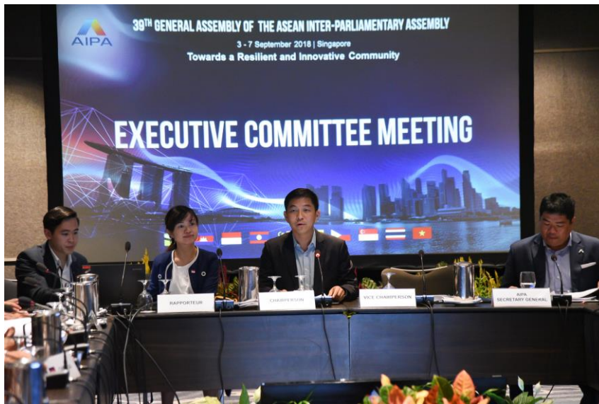
ประธานการประชุมคณะกรรมการบริหาร

ประธานการประชุมจึงเสนอให้ปรับคำในหัวข้อร่างข้อมติดังกล่าวให้มีความหมายอ่อนลงและทุกฝ่ายยอมรับได้ ซึ่งคณะผู้แทนจากประเทศลาว สิงคโปร์ มาเลเซีย ฟิลิปปินส์ และไทย ร่วมกันเสนอปรับคำในหัวข้อดังกล่าว ในที่สุด ที่ประชุมเห็นชอบการเรียบเรียงหัวข้อใหม่จากเดิม “Violent Attack on Rohingya and Humanitarian Crisis in Myanmar” เป็น “Humanitarian Situation in Myanmar” ซึ่งที่ประชุมเห็นว่า เมื่อเปลี่ยนชื่อหัวข้อใหม่แล้วจะสามารถหารือในรายละเอียดได้มากขึ้นในการประชุมคณะกรรมการด้านการเมือง ทำให้หัวข้อร่างข้อมติการประชุมคณะกรรมการด้านการเมืองได้รับความเห็นชอบทั้งหมด