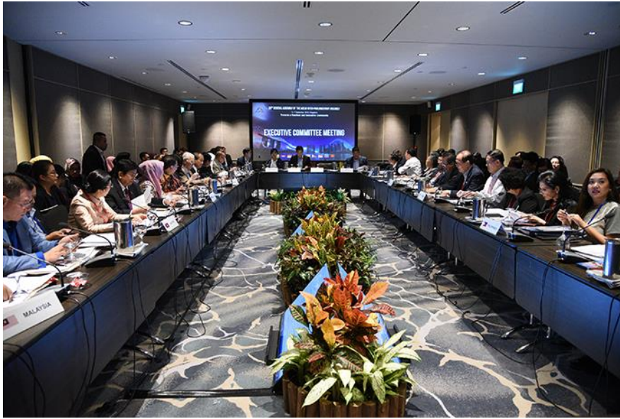
บรรยากาศการประชุมคณะกรรมการบริหาร