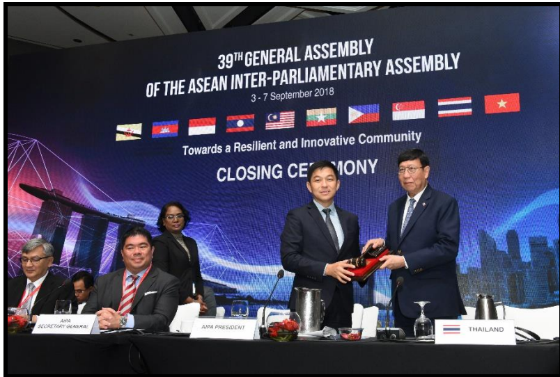
ศาสตราจารย์พิเศษพรเพชร วิชิตชลชัย ประธานสภานิติบัญญัติแห่งชาติ (คนแรกจากขวา) ขณะรับมอบตำแหน่งประธาน AIPA จาก H.E. Mr. Tan Chuan-Jin ประธานรัฐสภาสาธารณรัฐสิงคโปร์ (คนที่สองจากขวา)