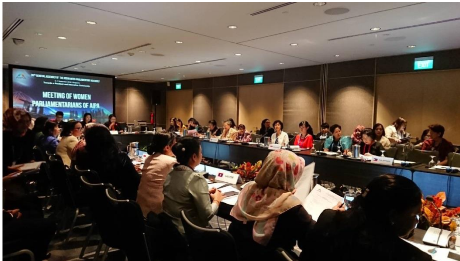
บรรยากาศในห้องประชุมคณะกรรมการด้านสมาชิกวุฒิสภาสตรีของสมาชิกรัฐสภาอาเซียน

ที่ประชุมแนะนำให้หอการค้าและสภาอุตสาหกรรมสนับสนุนการขยายโอกาสทางการตลาดและเพิ่มความเชื่อมโยงทางธุรกิจภายในประเทศสมาชิกอาเซียน หลังจากการอภิปราย ที่ประชุมเห็นชอบให้เพิ่มเติมข้อเสนอของคณะผู้แทนประเทศอินโดนีเซียเกี่ยวกับการส่งเสริมสภาพแวดล้อมที่เปิดกว้างสำหรับผู้ประกอบการสตรี รวมถึง การเพิ่มโอกาสในการเข้าถึงทรัพยากรด้านการเงิน การสร้างความตระหนักในเรื่องการเข้าถึงทรัพยากรด้านการเงิน และการฝึกอบรมผู้ประกอบการสตรี รวมทั้ง การสนับสนุนด้านการตลาดแก่ผู้ประกอบการสตรีเพื่อให้มั่นใจว่า ผู้ประกอบการสตรีจะสามารถเป็นเจ้าของธุรกิจและสามารถดำเนินธุรกิจได้อย่างยั่งยืน