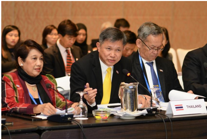
คณะผู้แทนสถานิติบัญญัติแห่งชาติในการประชุมคณะกรรมการด้านสังคม

กลั่นกรอง การสร้างข้อความ ข้อมูลอันเป็นเท็จ ทำได้ง่าย สะดวก รวดเร็วขึ้นไปพร้อมกัน ที่ร้ายแรงที่สุด คือ ข้อมูลถูกบิดเบือนเพื่อใช้เป็นเครื่องมือในการปลุกปั่น ยุยง ให้เกิดการดูหมิ่น เกลียดชัง หรือความเข้าใจผิดต่าง ๆ ได้ง่าย ซึ่งเป้าหมายสำคัญของร่างข้อมติว่าด้วยการสนับสนุนทักษะความเข้าใจและใช้เทคโนโลยีดิจิทัลเพื่อต่อสู้กับข่าวปลอมคือ การสร้างความตระหนักรู้ให้แก่ผู้รับข้อมูล การสร้างทักษะความเข้าใจและในการใช้เทคโนโลยีดิจิทัล รวมทั้งการแลกเปลี่ยนองค์ความรู้ระหว่างหน่วยงานในการสกัดกั้นข้อมูลอันเป็นเท็จ เพื่อจะได้ไม่ถูกชักจูงให้เกิดความคิด ความเห็นที่ไม่เกิดประโยชน์ต่อสังคมได้ ที่ประชุมเห็นชอบร่างข้อมตินี้โดยได้มีการเสนอปรับเปลี่ยนแก้ไข โดยเห็นชอบตามความเห็นของคณะผู้แทนสถานิติบัญญัติแห่งชาติที่เสนอว่า ต้องให้ความสำคัญต่อการสร้างทักษะการให้การศึกษาแก่เด็กและเยาวชนในการพิจารณาข้อมูลต่าง ๆ อย่างมีเหตุมีผล