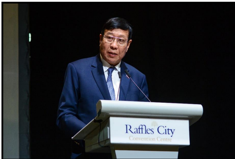
ศาสตราจารย์พิเศษพรเพชร วิชิตชลชัย ประธานสภานิติบัญญัติแห่งชาติ ขณะกล่าวสุนทรพจน์ต่อที่ประชุมใหญ่สมัชชารัฐสภาอาเซียน ครั้งที่ ๓๙

ภารกิจสำคัญของที่ประชุมคือการรับฟังคำกล่าวของหัวหน้าคณะผู้แทนรัฐสภาสมาชิกและคณะผู้แทนรัฐสภาผู้สังเกตการณ์ที่มาร่วมการประชุม สำหรับคณะผู้แทนสภานิติบัญญัติแห่งชาติ ประธานสภานิติบัญญัติแห่งชาติได้กล่าวสุนทรพจน์ ซึ่งมีสาระสำคัญ ๓ ประการ ประการแรก คือ สภานิติบัญญัติแห่งชาติเน้นย้ำความสำคัญของ AIPA ในฐานะเวทีความร่วมมือระหว่างรัฐสภาระดับภูมิภาค ซึ่งเปิดโอกาสให้บรรดาสมาชิกรัฐสภาได้อภิปราย แบ่งปัน และแลกเปลี่ยนแนวปฏิบัติต่าง ๆ อันเป็นประโยชน์ร่วมกัน ประการที่สอง คือ สภานิติบัญญัติแห่งชาติหวังว่า AIPA จะมีท่าทีที่ยืดหยุ่นและสร้างสรรค์ต่อภัยคุกคามข้ามพรมแดน อาทิ การก่อการร้าย อาชญากรรมไซเบอร์ การค้ามนุษย์ และผลกระทบจากภัยธรรมชาติ พร้อมนี้ได้ยกตัวอย่างเหตุการณ์ที่เกี่ยวข้องและเกิดขึ้นเมื่อไม่นานมานี้ เช่น เหตุการณ์ทีมฟุตบอลเยาวชนติดอยู่ในถ้ำหลวง จังหวัดเชียงราย เหตุการณ์เขื่อนแตกที่จังหวัดอุตรดิตถ์ปี สาธารณรัฐประชาธิปไตยประชาชนลาว และเหตุการณ์แผ่นดินไหวบนเกาะลอมบอก สาธารณรัฐอินโดนีเซีย และประการสุดท้าย คือ สภานิติบัญญัติแห่งชาติหวังว่า AIPA จะมีบทบาทมากขึ้นในการ