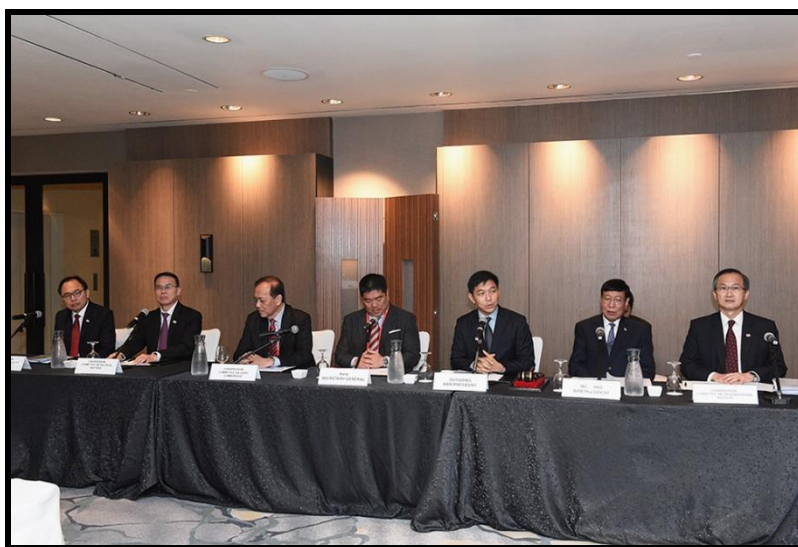
ศาสตราจารย์พิเศษพรเพชร วิชิตชลชัย ประธานสมานิติบัญญัติแห่งชาติ ในฐานะประธาน AIPA (คนที่สองจากขวา)