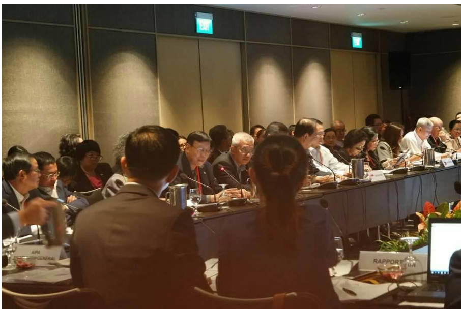
ประธานสภานิติบัญญัติแห่งชาติกล่าวแนะนำคณะผู้แทนสภานิติบัญญัติแห่งชาติ ในการประชุมคณะกรรมการบริหาร

ที่ประชุมคณะกรรมการบริหารได้พิจารณาระเบียบวาระการประชุมตามลำดับ ดังนี้