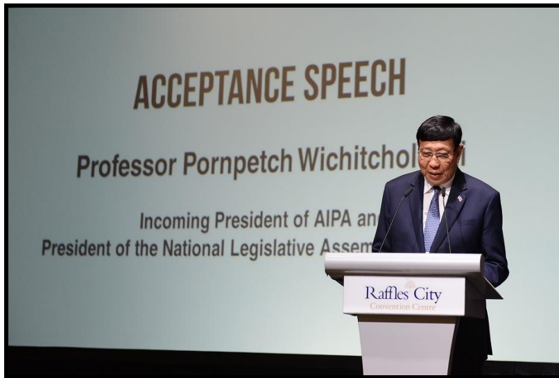
ศาสตราจารย์พิเศษพรเพชร วิชิตชลชัย ประธานสภานิติบัญญัติแห่งชาติ ขณะกล่าวสุนทรพจน์รับตำแหน่งประธาน AIPA

ทั้งนี้ ในโอกาสการรับตำแหน่งประธาน AIPA ประธานสภานิติบัญญัติแห่งชาติ ได้กล่าวสุนทรพจน์ ๔ ซึ่งระบุถึงความตั้งใจของรัฐบาลไทยในการทำงานร่วมกับรัฐสภาสมาชิก AIPA เพื่อบ่มเพาะความเป็นหุ้นส่วนระหว่างรัฐสภาเพื่อความยั่งยืน (Nurturing inter-parliamentary partnership for sustainability) ซึ่งรวมไปถึงเรื่องความสามารถในการฟื้นฟูสู่สภาวะปกติเมื่อได้รับผลกระทบ (Resilience) และเรื่องนวัตกรรม อันเป็นเรื่องที่มีการผลักดันในการประชุมครั้งนี้ ทั้งนี้ได้แสดงวิสัยทัศน์ในการดำรงตำแหน่งประธาน AIPA ความว่า บทบาทเชิงรุกของรัฐสภาเป็นสิ่งที่ขาดไปเสียมิได้ในการดำเนินการเพื่อความยั่งยืนระดับภูมิภาคและการบรรลุสู่ประชาคม