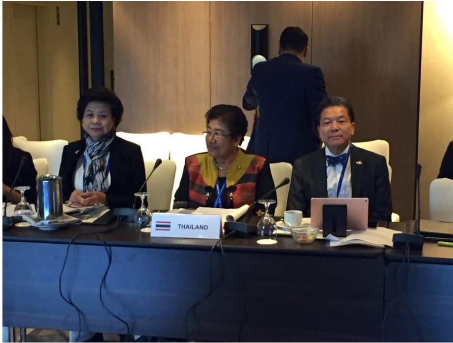
คณะผู้แทนสถานิติบัญญัติแห่งชาติระหว่างการประชุมคณะกรรมการด้านเศรษฐกิจ ในการประชุมใหญ่สมัชชารัฐสภาอาเซียน ครั้งที่ ๓๙