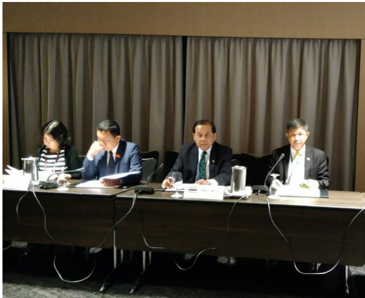
พลเรือเอก ศักดิ์สิทธิ์ เชิดบุญเมือง และพลอากาศเอก ชูชาติ บุญชัย คณะผู้แทนสถานิติบัญญัติแห่งชาติ เข้าร่วมการประชุมหารือกับประเทศแคนาดา

นอกจากนี้ ที่ประชุมได้กล่าวถึงความร่วมมือด้านอื่น ได้แก่ การค้า การลงทุน การท่องเที่ยวและการศึกษา รวมทั้งการแสวงหาความร่วมมือในเรื่องการเสริมสร้างศักยภาพกับประเทศแคนาดา