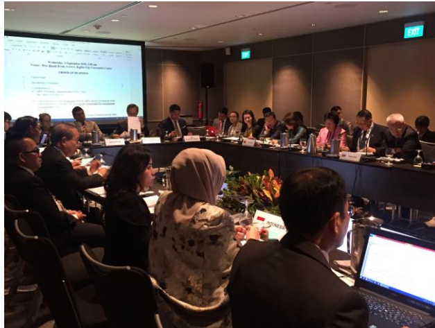
บรรยากาศในห้องประชุมคณะกรรมการด้านกิจการสมัชชารัฐสภาอาเซียน