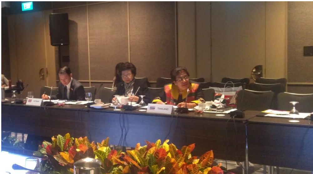
คณะผู้แทนสถานิติบัญญัติแห่งชาติในการหารือระหว่างผู้แทน AIPA กับประเทศผู้สังเกตการณ์ญี่ปุ่น

ในส่วนของผู้แทนจากรัฐสภาประเทศญี่ปุ่น ได้ชี้แจงสนับสนุนข้อเสนอของฝ่ายไทยถึงความพยายามในการยกระดับความร่วมมือระหว่างกัน รวมทั้งการแลกเปลี่ยนการเยือนระหว่างกัน ซึ่งเป็นแนวทางที่มีประโยชน์ในการเชื่อมความสัมพันธ์และหารือกันถึงแนวทางในการขยายความร่วมมือกันในประเด็นอื่นต่อไป