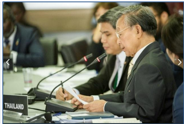
(ซ้าย) Ms. Gabriela Cuevas Barron ประธานสภาพรัฐสภาทำหน้าที่ประธานการประชุม Speakers' Dialogue (ขวา) ประธานรัฐสภาร่วมกล่าวอภิปรายแลกเปลี่ยนความคิดเห็นต่อที่ประชุมเสวนาโต๊ะกลมของประธานรัฐสภา

ในการนี้ ประธานรัฐสภาได้ร่วมอภิปรายแลกเปลี่ยนกับที่ประชุมโดยมีสาระสำคัญว่า จากประสบการณ์การเมืองอันยาวนานกว่า ๕๐ ปีของตนในฝ่ายนิติบัญญัติในฐานะสมาชิกสภาผู้แทนราษฎร ๑๖ สมัย ประธานสภาผู้แทนราษฎร ๒ สมัย และผู้นำฝ่ายค้าน ๓ สมัย รวมถึง ประสบการณ์ในฝ่ายบริหารในฐานะนายกรัฐมนตรี ๒ สมัย และรัฐมนตรีอีกหลายกระทรวง ได้ค้นพบข้อสรุปว่า ภาครัฐสภาจะต้องได้รับความร่วมมือจากฝ่ายบริหารในฐานะผู้นำนโยบายไปปฏิบัติ และฝ่ายบริหารจะต้องได้รับความร่วมมือจากฝ่ายนิติบัญญัติในฐานะผู้ตรากฎหมาย ผู้กำกับตรวจสอบ และผู้จัดสรรงบประมาณด้วย จึงจะสามารถร่วมกันแก้ไขปัญหาของประชาชนได้อย่างเป็นรูปธรรม โดยสมาชิกรัฐสภาซึ่งทำงานใกล้ชิดกับประชาชนจะเป็นผู้สื่อสารปัญหาและความต้องการของประชาชนไปให้รัฐบาลได้รับทราบผ่านกลไกรัฐสภา โดยเมื่อครั้งที่ตนได้ทำหน้าที่ในฝ่ายบริหาร มีนโยบายหลายเรื่องที่ได้รับการผลักดันและยังคงมีผลจนถึงปัจจุบัน อาทิ นโยบายโครงการนมโรงเรียน และนโยบายกองทุนกู้ยืมเพื่อการศึกษา เป็นต้น นอกจากนี้ การจัดการปัญหาการทุจริตคอร์รัปชันและธรรมาภิบาลถือเป็นเรื่องสำคัญที่จะช่วยลดปัญหาการเมืองไม่สุจริต และปัญหาธนกิจการเมือง (money politics) โดยหลักนิติธรรมที่วางอยู่บนการบังคับใช้กฎหมายอย่างเคร่งครัดและเสมอภาคจะช่วยลดปัญหาความเหลื่อมล้ำทางเศรษฐกิจและสังคมลงได้ ดังคำกล่าวที่ว่า "เราไม่สามารถทำให้ทุกคนร่ำรวยเท่าเทียมกันได้ แต่สามารถทำให้ทุกคนเท่าเทียมกันภายใต้กฎหมายได้"