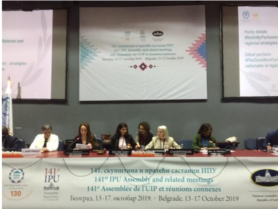
บรรยากาศการอภิปรายที่ทุกฝ่ายมีส่วนร่วม