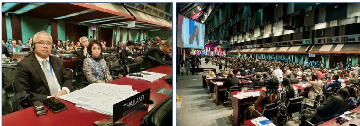
คณะผู้แทนรัฐสภาไทยเข้าร่วมการประชุมคณะมนตรีบริหารสหภาพรัฐสภา (วาระที่สอง ๑๗ ตุลาคม ๒๕๖๒)

๒๕๕๗ ทั้งนี้ เพื่อมิให้ไทยต้องถูกระงับสมาชิกภาพ สหภาพรัฐสภาจึงได้พยายามรักษาปฏิสัมพันธ์อย่างต่อเนื่องกับ สภานิติบัญญัติแห่งชาติในช่วงเปลี่ยนผ่าน เพื่อติดตามความก้าวหน้าตามโรดแมปประชาธิปไตย โดยสหภาพรัฐสภา ได้รับทราบด้วยความยินดีว่ารัฐสภาชุดใหม่ของไทยมีสมาชิกรัฐสภาสตรีและยุวสมาชิกรัฐสภา (Young MPs) ซึ่งเป็น คนรุ่นใหม่จำนวนมาก โดยสหภาพรัฐสภาพร้อมให้ความร่วมมือกับรัฐสภาชุดใหม่ของไทยในการจรรโลงประชาธิปไตยของ ไทยให้มีความมั่นคงและยั่งยืนต่อไป ต่อมา คณะผู้แทนรัฐสภาโปรตุเกสได้เสนอแปรญัตติให้ที่ประชุมพิจารณาลงมติ ตัดสินว่าที่ประชุมจะเห็นด้วยหรือไม่เห็นด้วยกับการรับรองข้อเสนอแนะของคณะกรรมการบริหารสหภาพรัฐสภา (Executive Committee) เกี่ยวกับกรณีสถานการณ์ของรัฐสภาในเยเมนซึ่งที่ประชุมได้ลงมติแบบขานชื่อที่ละประเทศ (Roll-call vote) และเสียงข้างมากของที่ประชุมเห็นด้วยให้รับรองข้อเสนอแนะดังกล่าวของคณะกรรมการบริหารฯ ด้วยคะแนนเสียงเห็นชอบ ๑๐๔ คะแนน ต่อคะแนนเสียงไม่เห็นชอบ ๒๔ คะแนนและงดออกเสียง ๓๙ คะแนน