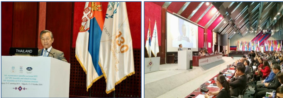
ประธานรัฐสภากล่าวถ้อยแถลงในนามคณะผู้แทนรัฐสภาไทยต่อที่ประชุมสมัชชา IPU ครั้งที่ ๑๔๑

นอกจากนี้ประเทศไทยยังมีความก้าวหน้าในการดำเนินการเพื่อบรรลุเป้าหมายการพัฒนาที่ยั่งยืนของสหประชาชาติ (SDGs) ด้วยการน้อมนำหลักปรัชญาเศรษฐกิจพอเพียงของสมเด็จพระบรมชนกนาถธิเบศร มหาภูมิพลอดุลยเดชมหาราช บรมนาถบพิตร เป็นแกนหลักในการขับเคลื่อนการบรรลุ SDGs ของประเทศ และเน้นย้ำถึงบทบาทสำคัญของรัฐสภาในการออกแบบกรอบกฎหมายเพื่อให้สอดคล้องกับพันธะสัญญาที่ให้ไว้กับประชาชน และสอดคล้องกับพันธกรณีระหว่างประเทศของไทยด้วย ประเทศไทยให้ความสำคัญอย่างยิ่งต่อสหประชาชาติตลอดจนวาระสำคัญของสหประชาชาติ อาทิ การคุ้มครองสิทธิมนุษยชน การส่งเสริมความมั่นคงของมนุษย์ การอนุรักษ์สิ่งแวดล้อม และการสนับสนุนกระบวนการรักษาสันติภาพของ UN โดยประเทศไทยยังคงยึดมั่นในพันธกรณีของไทยภายใต้กฎบัตรสหประชาชาติและกฎบัตรอาเซียน ด้วยไทยเชื่อว่าระเบียบกฎหมายระหว่างประเทศเป็นหลักยึดเหนี่ยวสำคัญที่ปกป้องคุ้มครองเอกราชและอธิปไตยของทุกประเทศ