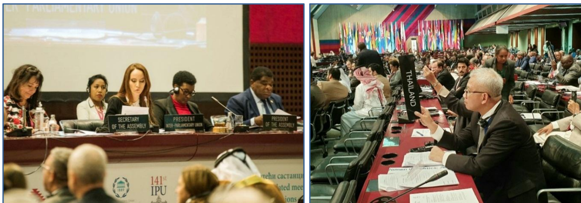
(ขวา) คณะผู้แทนรัฐสภาไทยร่วมลงคะแนนเสียงเห็นชอบรับรองข้อเสนอแนะของ คณะกรรมการบริหารว่าด้วยกรณีเยเมน