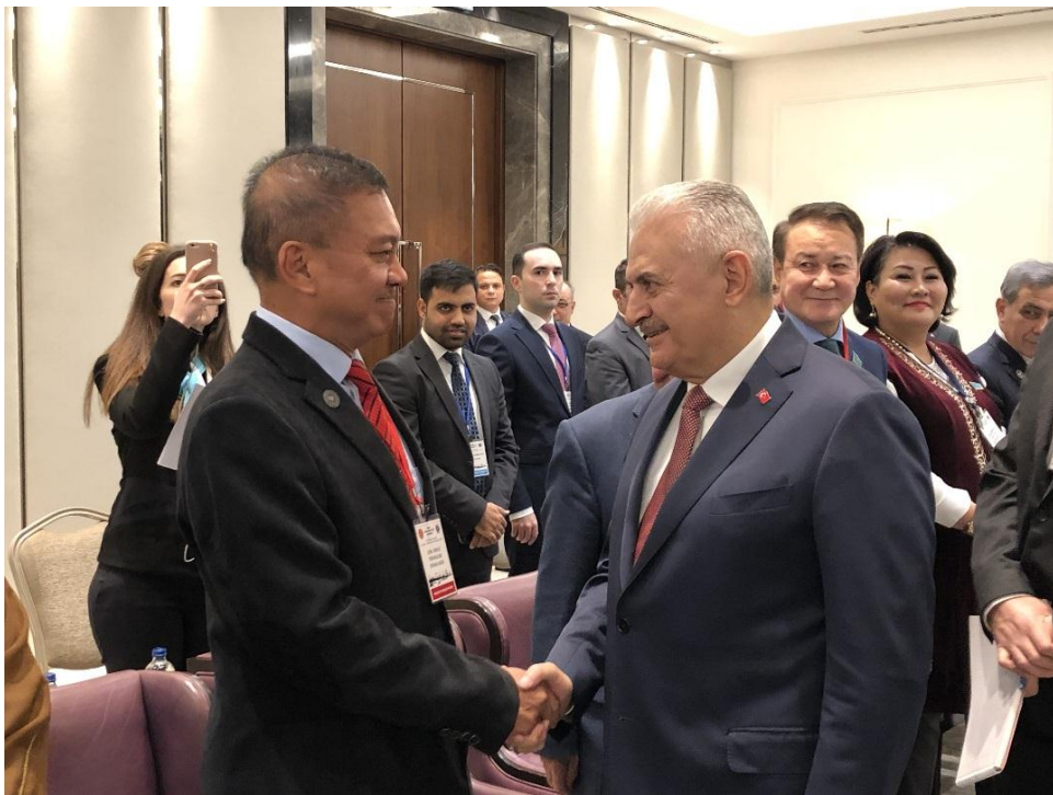
พลเอก นิพัทธ์ ทองเล็ก สมาชิกสภานิติบัญญัติแห่งชาติ และหัวหน้าคณะผู้แทนฯ เข้าเยี่ยมคารวะ นาย Binali YILDIRIM ประธานรัฐสภาตุรกี ก่อนเข้าสู่พิธีเปิดการประชุมสมัชชาใหญ่ APA ครั้งที่ ๑๑