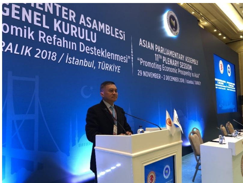
พลเอก นิพัทธ์ ทองเล็ก สมาชิกสภานิติบัญญัติแห่งชาติ ในฐานะหัวหน้าคณะผู้แทนฯ กล่าวถ้อยแถลงต่อที่ประชุมสมัชชาใหญ่ของ APA

ต่อมา คณะกรรมการฯ ว่าด้วยสังคมและวัฒนธรรมได้มีการพิจารณาร่างข้อมติจากการประชุมคณะกรรมการฯ ว่าด้วยสังคมและวัฒนธรรม ซึ่งจัดขึ้นที่เมืองอิสตันบูล ตุรกี ก่อนให้การรับรองและนำส่งไปยังที่ประชุมสมัชชาใหญ่เพื่อการรับรองต่อไป