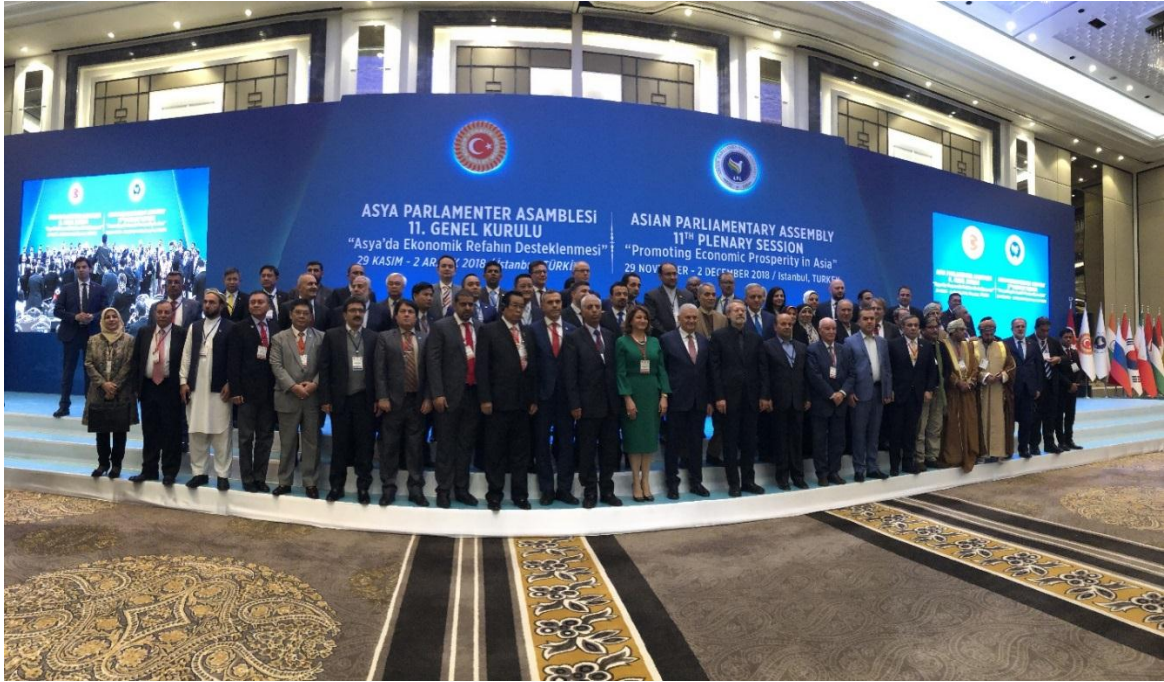
คณะผู้แทนที่เข้าร่วมการประชุมสมัชชาใหญ่ของสมัชชารัฐสภาเอเชีย ครั้งที่ ๑๑ ถ่ายภาพร่วมกัน ในช่วงพิธีเปิดการประชุม