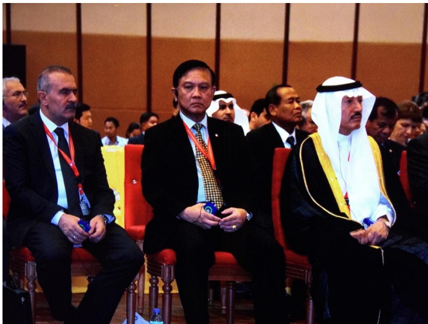
พลเรือเอก อมรเทพ ฌ บางช้าง หัวหน้าคณะผู้แทนสถานนิติบัญญัติแห่งชาติ เข้าร่วมพิธีเปิดการประชุม APA ครั้งที่ ๘

ในการประชุมคณะกรรมการ ครั้งที่ ๑ ซึ่งมีการเสนอประเด็นเกี่ยวกับการลดองค์ประชุมในการประชุม สมัชชาใหญ่และการประชุมคณะกรรมการลงนั้น ที่ประชุมได้มีมติอย่างเป็นเอกฉันท์ว่าไม่เห็นด้วยกับการลด จำนวนองค์ประชุมลง โดยผู้เข้าร่วมประชุมเน้นย้ำถึงความสำคัญในการเข้าร่วมการประชุมอย่างน้อยกึ่งหนึ่งและ สมาชิก APA อีก ๑ คนตามที่เคยระบุไว้ โดยสรุปว่าจะมีการพิจารณาตามที่ร้องขอต่อไปในอนาคต