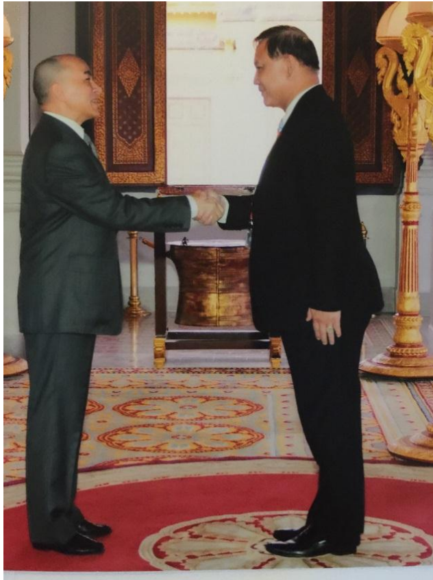
พลเรือเอก อมรเทพ ณ บางช้าง สมาชิกสภานิติบัญญัติแห่งชาติ และหัวหน้าคณะผู้แทนฯ เข้าเฝ้าฯ พระบาทสมเด็จพระบรมชนกาธิเบศร มหาภูมิพลอดุลยเดชมหาราช บรมนาถบพิตร ณ พระที่นั่งอานาจักร กรุงเทพมหานคร