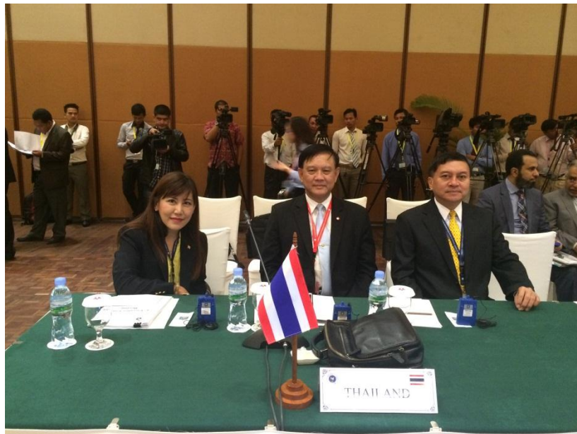
คณะผู้แทนสภานิติบัญญัติแห่งชาติเข้าร่วมการประชุมคณะมนตรีบริหาร ครั้งที่ ๒