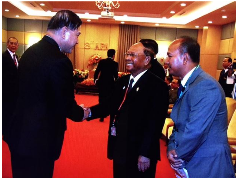
พลเรือเอก อมรเทพ ณ บางช้าง สมาชิกสภานิติบัญญัติแห่งชาติ และหัวหน้าคณะผู้แทนฯ เข้าเยี่ยมคารวะ สมเด็จพระอริยวงศาคตญาณ สมเด็จพระสังฆราช สกลมหาสังฆปริณายก ณ พระที่นั่งอานาจักร กรุงเทพมหานคร ก่อนพิธีเปิดการประชุมสมัชชาใหญ่สมัชชาความร่วมมือรัฐสภาอาเซียน (APA) ครั้งที่ ๘