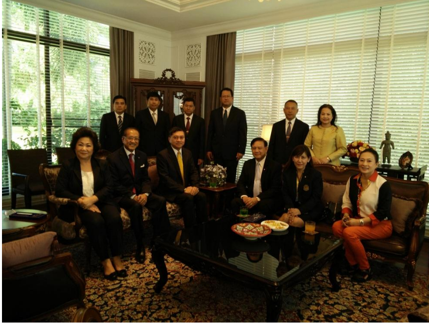
คณะผู้แทนสถานติบัญญัติแห่งชาติเข้าเยี่ยมคารวะเอกอัครราชทูต ณ ทำเนียบเอกอัครราชทูต กรุงเทพมหานคร