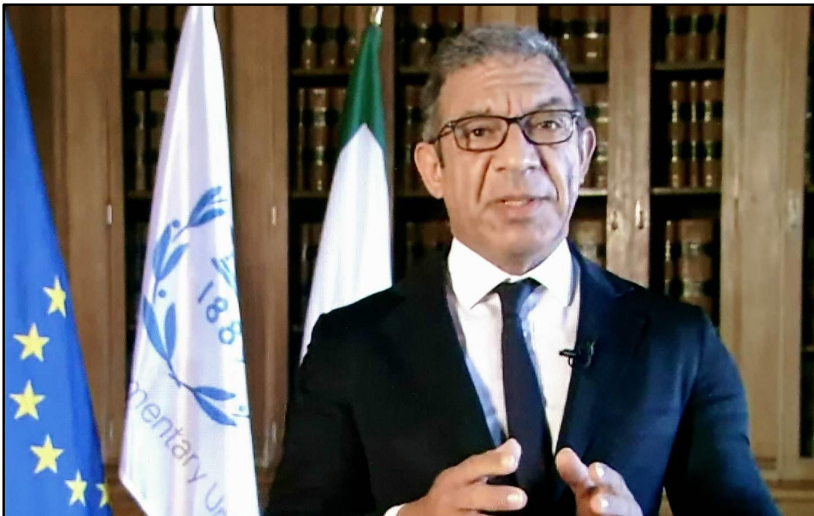
Mr. Duarte Pacheco ประธานสหภาพรัฐสภาคนใหม่ กล่าวถ้อยแถลงระหว่างการสัมมนา

๕. ในช่วงหนึ่งของการสัมมนาได้เปิดโอกาสให้สมาชิกรัฐสภาจากทั่วโลกที่เข้าร่วมการประชุมร่วมแสดงความคิดเห็น โดยมีสมาชิกรัฐสภาจากอินเดีย สาธารณรัฐประชาชนจีน และกาบอง ร่วมแสดงความคิดเห็นในประเด็นต่างๆ เช่น การเร่งพัฒนาวัคซีนป้องกันโควิด-๑๙ การให้ความช่วยเหลือทางการค้า (Aid for Trade) แก่กลุ่มประเทศที่พัฒนาน้อยที่สุด (Least Developed Countries : LDC) การอำนวยความสะดวกทางการค้าให้แก่ประเทศกำลังพัฒนา การคำนึงถึงปัจจัยของการเปลี่ยนแปลงสภาพภูมิอากาศซึ่งจะส่งผลให้การฟื้นฟูภายหลังวิกฤตโควิด-๑๙ ยากลำบากมากยิ่งขึ้น และเห็นควรให้นานาประเทศยึดมั่นในการดำเนินการเจรจาภายใต้กรอบองค์การการค้าโลกต่อไปโดยคำนึงถึงผลประโยชน์ของประชาชนเป็นสำคัญ