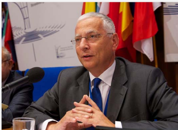
นาย Wojciech Sawicki เลขาธิการสมัชชารัฐสภาคณะมนตรีแห่งยุโรป

นาย Wojciech Sawicki เลขาธิการสมัชชารัฐสภาคณะมนตรีแห่งยุโรป (Parliamentary Assembly of the Council of Europe – PACE) กล่าวอภิปรายต่อที่ประชุมว่า ตนรู้สึกเป็นเกียรติอย่างยิ่งที่ได้เข้าร่วมการประชุมร่วมกับเลขาธิการรัฐสภาจากรัฐสภาสมาชิกสมาคมเลขาธิการรัฐสภา ซึ่งการเข้าร่วมการประชุมครั้งนี้เป็นครั้งแรกและอาจเป็นครั้งสุดท้ายของตนเอง และขอถือโอกาสนี้แลกเปลี่ยนข้อคิดเห็นในประเด็นการปรับตัวเกี่ยวกับกระบวนการดำเนินงานทางด้านรัฐสภาในช่วงการแพร่ระบาดของโรคติดเชื้อไวรัสโคโรนา ๒๐๑๙ ซึ่งคณะมนตรีแห่งยุโรปให้ความสำคัญเกี่ยวกับมาตรการการรับมือต่อการแพร่ระบาดของโรคติดเชื้อดังกล่าว โดยได้กำหนดแนวทางการปฏิบัติงานให้บุคลากรปฏิบัติงานนอกสถานที่ (Work from Home) และยกระดับความเข้มงวดของมาตรการทางกายภาพ สำหรับการประชุมสมัชชารัฐสภาคณะมนตรีแห่งยุโรป ได้จัดให้มีการประชุมผ่านสื่ออิเล็กทรอนิกส์ตามภารกิจและหน้าที่ ซึ่งการประชุมสมัชชารัฐสภาคณะมนตรีแห่งยุโรป จะแบ่งออกเป็นห้องประชุมย่อยต่าง ๆ เช่น ห้องประชุมสำหรับคณะกรรมการสิทธิมนุษยชน และห้องประชุมคณะกรรมการย่อย เป็นต้น ทั้งนี้ สมาชิกรัฐสภาสามารถติดตามการประชุม หรือการดำเนินงานผ่านช่องทางอิเล็กทรอนิกส์