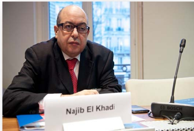
นาย Najib El Khadi เลขาธิการสภาผู้แทนราษฎรโมร็อกโก ทำหน้าที่ผู้ดำเนินรายการในการประชุม

ต่อมา เลขาธิการสภาผู้แทนราษฎรโมร็อกโก ได้กล่าวเปิดการประชุม โดยอภิปรายถึงอุปสรรคในการจัดการประชุมของรัฐสภาอันเนื่องมาจากสถานการณ์การแพร่ระบาดของโรคโควิด-๑๙ ได้ส่งผลให้รัฐสภาทั่วโลกมีการปรับตัวเพื่อให้สามารถปฏิบัติหน้าที่ต่อไปได้ โดยมีการใช้เครื่องมือทางดิจิทัลเข้ามาสนับสนุนในการจัดการประชุม ทั้งนี้ สภาผู้แทนราษฎรโมร็อกโกได้มีการปรับเปลี่ยนรูปแบบในการปฏิบัติหน้าที่ โดยได้จัดทำเอกสารข้อมูลดังกล่าวเป็นรูปเล่มเพื่อเผยแพร่ประชาสัมพันธ์ต่อสาธารณะ