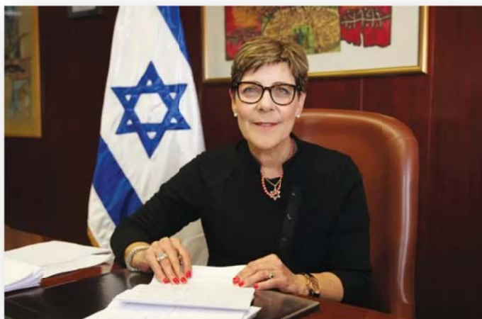
นาง Yardena Meller-Horovitz เลขาธิการรัฐสภาอิสราเอล

นาง Yardena Meller-Horovitz เลขาธิการรัฐสภาอิสราเอล กล่าวว่า ในฐานะเลขาธิการรัฐสภาอิสราเอล ขอแลกเปลี่ยนประสบการณ์เกี่ยวกับการปรับตัวในการดำเนินงานในช่วงการแพร่ระบาดของโรคติดเชื้อไวรัสโคโรนา ๒๐๑๙ (โควิด-๑๙) โดยรัฐสภาอิสราเอลได้กำหนดให้ใช้มาตรการการเว้นระยะห่างทางสังคม โดยในส่วนของสมาชิกรัฐสภา จะมีการแบ่งออกเป็น ๒ กลุ่ม และจัดให้มีการประชุมผ่านสื่ออิเล็กทรอนิกส์ และมีการแยกสำหรับการลงคะแนนเสียง สำหรับประชาชนทั่วไปสามารถมีส่วนร่วมในกระบวนการนิติบัญญัติผ่านสื่ออิเล็กทรอนิกส์ในรูปแบบ Zoom Application โดยรัฐสภาอิสราเอลได้กำหนดช่องทางและรูปแบบในการมีส่วนร่วมในด้านนิติบัญญัติของสาธารณชน ในส่วนของบุคลากรในวงงานรัฐสภาจะต้องปฏิบัติตามข้อแนะนำของรัฐมนตรีที่เกี่ยวข้องเกี่ยวกับการปฏิบัติตามมาตรการป้องกันการแพร่ระบาดของโรคติดเชื้อไวรัสโคโรนา ๒๐๑๙ โดยเคร่งครัด