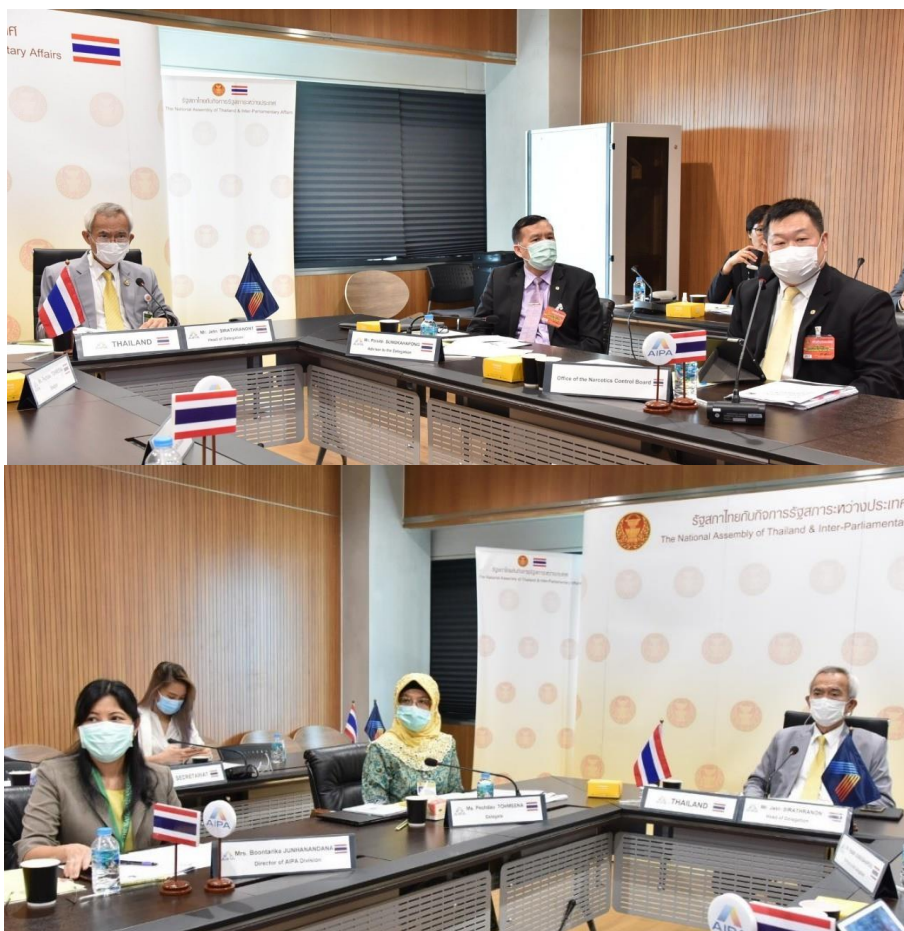
บรรยากาศในการประชุม

(DAINAP) ซึ่งประเทศสมาชิกอาเซียนและจีนเป็นสมาชิกของระบบดังกล่าวด้วย โดยทุกประเทศจะมีหน่วยงานกลาง ซึ่งรับผิดชอบด้านยาเสพติดจะเป็นผู้ส่งข้อมูลเข้าระบบ เพื่อให้ UNODC วิเคราะห์ และส่งข้อมูลกลับมายังประเทศสมาชิกอาเซียน