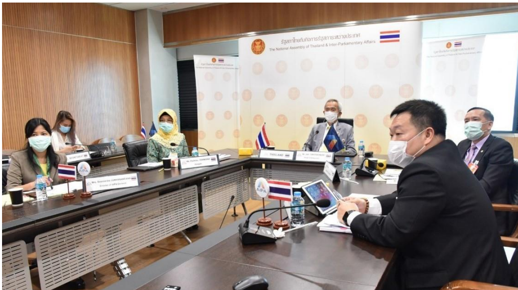
บรรยากาศในการประชุม

เนการาบรูไนดารุสซาลาม ในปี ๒๕๖๓ จำนวนผู้กระทำความผิดเกี่ยวกับยาเสพติดที่ถูกจับกุมในบรูไนดารุสซาลามเพิ่มขึ้นร้อยละ ๒๒ เมื่อเทียบกับผู้กระทำความผิดเกี่ยวกับยาเสพติดที่ถูกจับกุมในปี ๒๕๖๒ โดยเฉพาะอย่างยิ่ง ‘Syabu’ ซึ่งอยู่ในกลุ่มเมทิลแอมเฟตามีน ซึ่งเป็นยาเสพติดที่นิยมมากที่สุดในกลุ่มผู้กระทำความผิดด้านยาเสพติด รวมถึงกัญชาซึ่งเป็นยาเสพติดที่นิยมลำดับถัดมา และแม้ว่าตามสถิติกลุ่มผู้กระทำความผิดด้านยาเสพติดจะอยู่ในกลุ่มผู้ที่อายุ ๓๐ ปี แต่ในปี ๒๕๖๓ มีการจับกุมเยาวชนอายุต่ำกว่า ๑๘ ปี ในจำนวนที่ใกล้เคียงกับปี ๒๕๖๒ ทำให้มีความกังวลอย่างมากเกี่ยวกับการเข้าไปข้องเกี่ยวกับยาเสพติดของเยาวชนและได้เรียกร้องให้ผู้ปกครองติดตามพฤติกรรมและการดำเนินกิจกรรมของบุตรหลานอย่างใกล้ชิด เพื่อเป็นการป้องกันอิทธิพลเชิงลบและความเจ็บป่วยหรือปัญหาทางสังคม ตลอดจนได้นำมาตรการและแผนงานต่าง ๆ มาใช้ เพื่อให้มั่นใจว่าการลดการใช้ยาเสพติด ไม่ได้มุ่งเน้นเฉพาะการบังคับใช้กฎหมายเท่านั้น แต่ยังพยายามสร้างการตระหนักรู้และการศึกษาเชิงป้องกันผ่านโครงการต่าง ๆ อาทิ การใช้โรงเรียน สถานที่ทำงาน และโครงการในชุมชนเป็นฐานในการดำเนินการ รวมถึง โครงการรักษาและฟื้นฟูสมรรถภาพอย่างเร่งด่วนสำหรับผู้ที่ใช้ยาเสพติดและระบบการเฝ้าติดตามดูแลหลังการรักษาอย่างต่อเนื่องก็ถูกนำมาใช้เช่นกัน