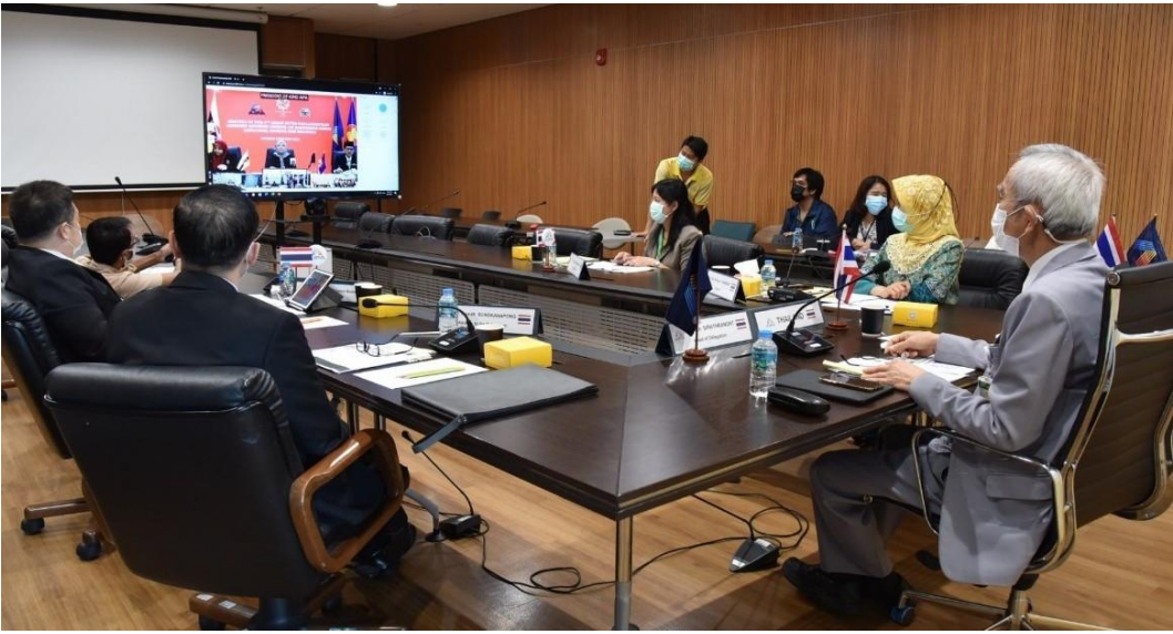
บรรยากาศในการประชุม

ในการประชุมครั้งที่ ๓ ที่ประชุมได้พิจารณาและรับรองรายงานการประชุมคณะมนตรีที่ปรึกษาของสมัชชารัฐสภาอาเซียนว่าด้วยยาเสพติดอันตราย ครั้งที่ ๔ (The 4 th Meeting of AIPA Advisory Council on Dangerous Drugs) และจะนำไปเสนอต่อที่ประชุมใหญ่สมัชชารัฐสภาอาเซียน ครั้งที่ ๔๒ ต่อไป