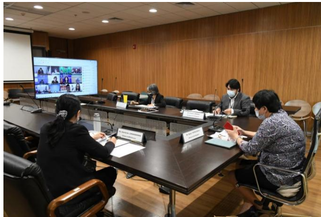
บรรยากาศการประชุมคณะทำงานของ AIPA ผ่านสื่ออิเล็กทรอนิกส์

ที่ประชุมเห็นชอบข้อสังเกตดังกล่าว และคณะผู้แทนประเทศฟิลิปปินส์ได้เสนอแก้ไขเพิ่มเติมบทบัญญัติในส่วนที่ ๑๕ เกี่ยวกับสถานที่จัดประชุม ในเนื้อหาของร่างระเบียบและขั้นตอนการเป็นเจ้าภาพจัดการประชุมใหญ่สมัชชารัฐสภาอาเซียน เพื่อปรับให้เข้ากับสถานการณ์ที่ท้าทายที่เกิดขึ้น เช่น การแพร่ระบาดของโรคโควิด-๑๙ เป็นต้น โดยมีเนื้อหาเกี่ยวกับการให้ประเทศเจ้าภาพจัดการประชุมผ่านสื่ออิเล็กทรอนิกส์ได้ในกรณีที่สมาชิกรัฐสภาไม่สามารถเข้าร่วมประชุมได้ด้วยเหตุต่าง ๆ เช่น การเกิดภัยพิบัติ โรคระบาด การประท้วง เป็นต้น ทั้งนี้ การแก้ไขดังกล่าวส่งผลให้มีการแก้ไขธรรมนูญ AIPA ข้อ ๙ (๓) เพื่อให้มีความสอดคล้องกัน จากนั้น ที่ประชุมได้พิจารณาร่างข้อมติว่าด้วยระเบียบและขั้นตอนในการเป็นเจ้าภาพจัดการประชุมใหญ่สมัชชาอาเซียน และให้ความเห็นชอบร่างข้อมติดังกล่าว