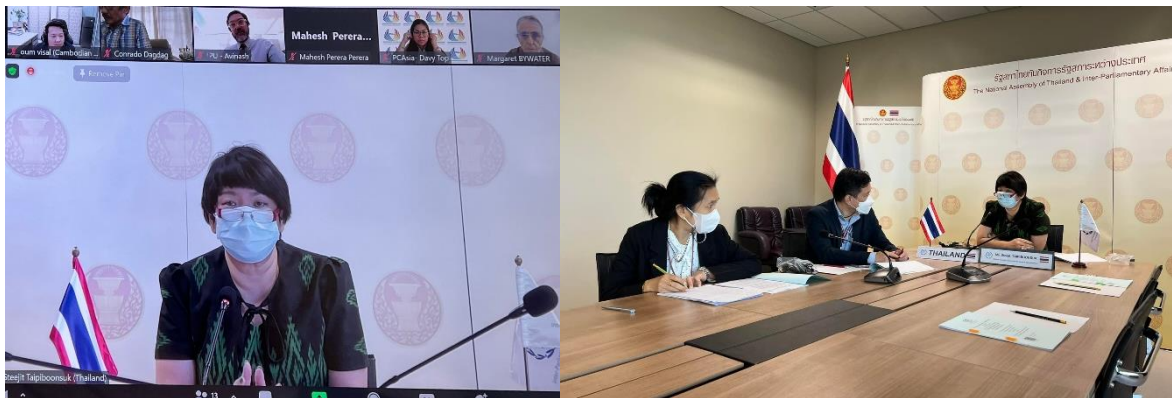
นางสาวสติจิตร ไตรพิบูลย์สุข รองเลขาธิการสภาผู้แทนราษฎร กำกับดูแลด้านต่างประเทศ เข้าร่วมการอภิปรายเฉพาะกลุ่มออนไลน์เพื่อจัดเตรียมรายงานรัฐสภาอิเล็กทรอนิกส์โลก ประจำปี ๒๕๖๕

ในการแบ่งปันความรู้และประสบการณ์ที่ได้รับแก่รัฐสภาประเทศอื่นในภูมิภาค และผลลัพธ์จากการอภิปรายดังกล่าวจะนำไปศึกษาวิเคราะห์เพื่อจัดเตรียมรายงานรัฐสภาอิเล็กทรอนิกส์โลก ประจำปี ๒๕๖๕ ในครั้งนี้ นางสาวสติจิตร ได้ร่วมอภิปราย โดยมีใจความสำคัญว่า รัฐสภามีความกระตือรือร้นที่จะปรับเปลี่ยนวิธีการทำงานให้เหมาะสมกับสถานการณ์ อาทิ การปฏิบัติงาน ณ ที่พักอาศัย การจัดหาอุปกรณ์เทคโนโลยีและจัดเตรียมห้องประชุมเพื่อรองรับการประชุมผ่านสื่ออิเล็กทรอนิกส์ ซึ่งสำนักงานเลขาธิการสภาผู้แทนราษฎรได้มีการนำระบบประชุมผ่านสื่ออิเล็กทรอนิกส์เข้ามาใช้อย่างแพร่หลาย ทั้งในส่วนของการประชุมภายในหน่วยงาน การประชุมกับหน่วยงานภายนอก การประชุมกรรมการ และการประชุมกับรัฐสภาต่างประเทศ ไปจนถึงการจัดฝึกอบรมข้าราชการในสำนักงานฯ ซึ่งขณะนี้อาคารรัฐสภามีห้องประชุมกรรมการที่รองรับระบบการประชุมผ่านสื่ออิเล็กทรอนิกส์ อีกทั้งสำนักงานฯ ได้มีการใช้งานระบบสารบรรณอิเล็กทรอนิกส์มาอย่างต่อเนื่อง โดยระบบนี้มีบทบาทสำคัญในกระบวนการของสำนักงานฯ ในช่วงวิกฤตโรคโควิด-๑๙ ซึ่งทำให้ข้าราชการสามารถเข้าถึงและจัดส่งเอกสารทางระบบสารบรรณอิเล็กทรอนิกส์ได้จากทุกที่และทุกเวลา นอกจากนี้ยังมีการใช้งานระบบเครือข่ายเสมือน เพื่อให้ผู้ที่ปฏิบัติงาน ณ ที่พักอาศัย สามารถเข้าถึงข้อมูลภายในหน่วยงานได้อย่างสะดวก และปลอดภัย รวมถึงมีการจัดอบรมด้านเทคโนโลยีเพื่อพัฒนาความรู้ความสามารถของเจ้าหน้าที่ผู้ปฏิบัติงาน ให้มีความรู้เท่าทันเทคโนโลยี เพื่อให้การปฏิบัติงานเกิดประสิทธิภาพสูงสุด พร้อมสำหรับการเปลี่ยนแปลงวิธีการปฏิบัติงาน