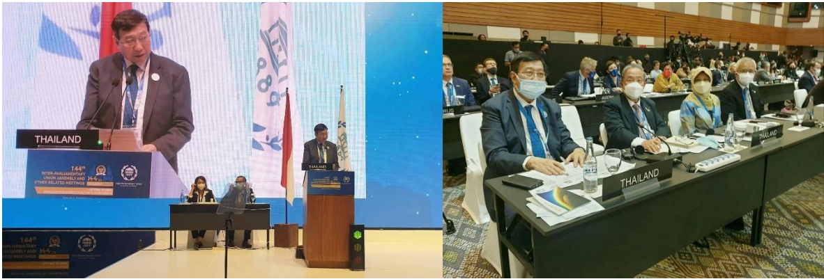
ศาสตราจารย์พิเศษพรเพชร วิชิตชลชัย ประธานวุฒิสภา นำคณะผู้แทนรัฐสภาไทยเข้าร่วมการประชุมสมัชชาสหภาพรัฐสภา ครั้งที่ ๑๔๔

ปัญหาเร่งด่วนที่นานาชาติต่างเผชิญร่วมกัน เพื่อให้เป็นไปตามพันธกรณีของข้อตกลงปารีส และเพื่ออนาคตที่ยั่งยืนของโลกใบนี้และอนุชนรุ่นหลัง นอกจากนี้ ได้เน้นย้ำความรับผิดชอบร่วมกันของระบบสาธารณสุข ซึ่งต้องมีการส่งเสริมความร่วมมือและบูรณาการกับทุกภาคส่วนในโครงการนำร่องการทบทวนหลักประกันสุขภาพถ้วนหน้าและความมั่นคงทางสุขภาพด้านการเตรียมความพร้อมและการตอบสนองต่อวิกฤตหรือภาวะฉุกเฉินด้านสาธารณสุข ทั้งนี้ ประเทศไทยเป็นหนึ่งในสามประเทศในภูมิภาคอาเซียนที่นำร่องดำเนินการในเรื่องนี้ ซึ่งได้เตรียมการหารือร่วมกับองค์การอนามัยโลกตั้งแต่ปี ๒๕๖๔ เพื่อเตรียมการนำเรื่องดังกล่าวไปปฏิบัติ โดยหวังที่จะรับฟังประสบการณ์และแนวปฏิบัติที่ดีจากนานาชาติด้วย