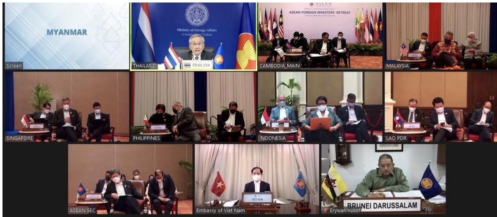
การประชุมรัฐมนตรีต่างประเทศอาเซียนอย่างไม่เป็นทางการ ผ่านระบบการประชุมทางไกล

เมื่อวันที่ ๒๕ กุมภาพันธ์ ๒๕๖๕ พลเอก ประยุทธ์ จันทร์โอชา นายกรัฐมนตรี ได้พบหารือกับดาโต๊ะ ศรี อิชมาอิล ซาบรี ยาคอบ นายกรัฐมนตรีมาเลเซีย ที่ทำเนียบรัฐบาล ในโอกาสการเยือนประเทศไทยอย่างเป็นทางการ ระหว่างวันที่ ๒๔ - ๒๖ กุมภาพันธ์ ๒๕๖๕ ในโอกาสนี้ นายกรัฐมนตรีทั้งสองประเทศได้แสดงเจตนารมณ์ร่วมกันที่จะยกระดับความสัมพันธ์ระหว่างไทยและมาเลเซียสู่การเป็นหุ้นส่วนยุทธศาสตร์ที่แน่นแฟ้น และจะร่วมมือกันอย่างใกล้ชิดเพื่อฟื้นฟูประเทศจากผลกระทบของการแพร่ระบาดของโรคติดเชื้อไวรัสโคโรนา ๒๐๑๙ (โควิด-๑๙) เพื่อนำมาซึ่งความมั่นคงและความกินดีอยู่ดีที่ยั่งยืนของประชาชนของทั้งสองประเทศ โดยผู้นำทั้งสองได้เห็นพ้องกันที่จะผลักดันการเปิดการเดินทางระหว่างกันสำหรับผู้ที่ได้รับวัคซีนครบโดสโดยไม่ต้องกักกันโรค ในโอกาสแรก เพื่อกระตุ้นการฟื้นตัวทางเศรษฐกิจและการท่องเที่ยว รวมทั้งการยอมรับใบรับรองการฉีดวัคซีนป้องกันโรคโควิด-๑๙ แบบดิจิทัลร่วมกัน ซึ่งจะช่วยอำนวยความสะดวกในการเดินทางเข้าประเทศระหว่างกันต่อไป นอกจากนี้ ทั้งสองฝ่ายยังเห็นพ้องที่จะเร่งรัดการดำเนินโครงการส่งเสริมความเชื่อมโยงชายแดน เช่น การสร้างถนนเชื่อมต่อด่านสะเดาแห่งใหม่กับด่านบูกิตกายูฮิตัมของมาเลเซีย การสร้างสะพานข้ามแม่น้ำโก-ลกแห่งใหม่ ๒ แห่ง รวมถึงการพัฒนาพื้นที่ชายแดนร่วมกัน